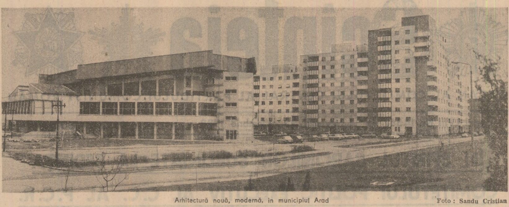
Ahitectură nouă, modernă, în municipiul Arad.

Preocupările Uniunii județene a cooperativei de producție, achiziții și desfacere a mărfurilor din județul Sibiu se concretizează și în continua dezvoltare și modernizare a bazei materiale, prin înființarea și reprofiliarea unor unități comerciale și prestatoare de servicii. În Serban, subliniază din cele 43 de organizații de partid din această puțnică unitate au fost înființate 10 unități comerciale și prestatoare de servicii.