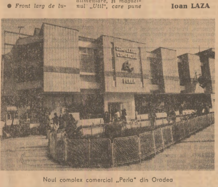
Noul complex comercial „Perla” din Oradea