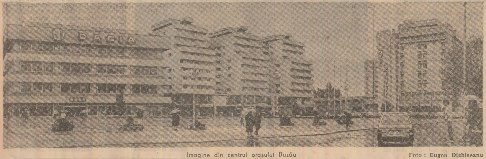
Imagine din centrul orașului Buzău