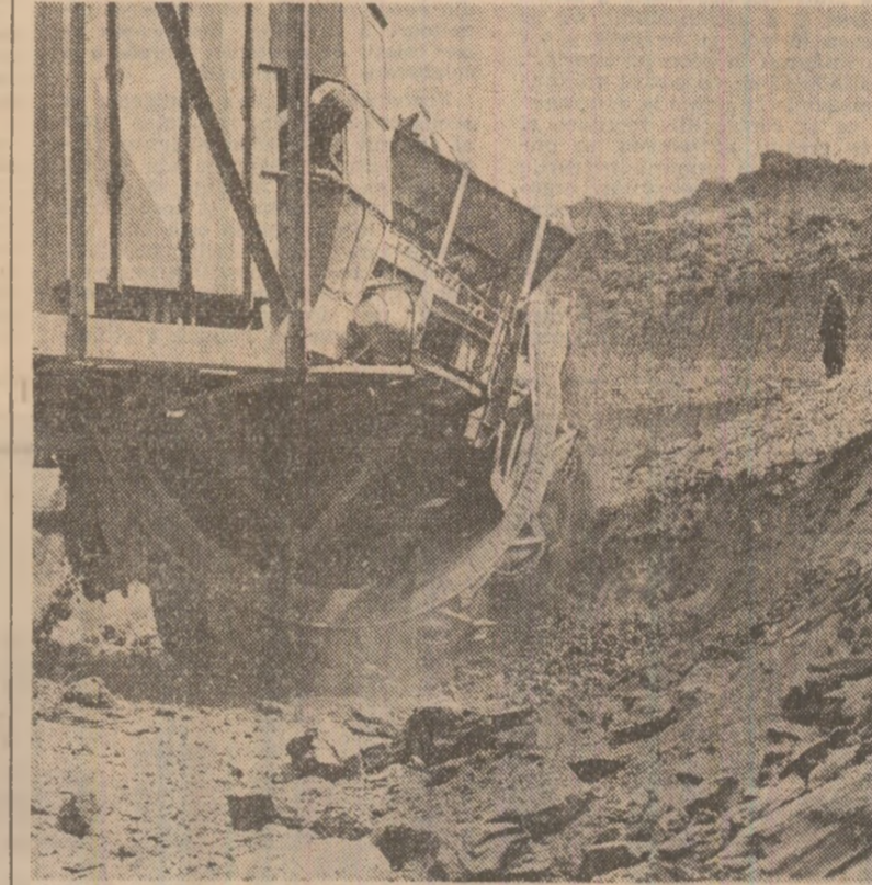
În corierile Gorjului se acționează intens pentru sporierea cantităților de cărbune livrat termocentralelor