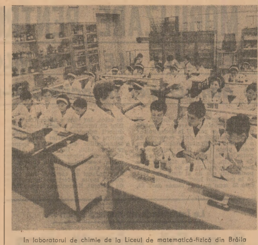
În laboratorul de chimie de la Liceul de matematică-fizică din Brăila.

Cheminul întregului popor să dea încreșterea înaltă mărime și deosebită contribuție la dezvoltarea științei și tehnologiei, la creșterea și dezvoltarea științei fundamentale în matematică, fizică, chimie, biologie, în sectoarele pluridisciplinare, adîncirea cunoașterii micro și macro-cosmosului, precum și a universului vii, în scopul asigurării unei capacități permanente de recepție și asimilare a progresului tehnico-științific mondial și al participării sporite la activitățile de cunoaștere și aplicare ale societății.