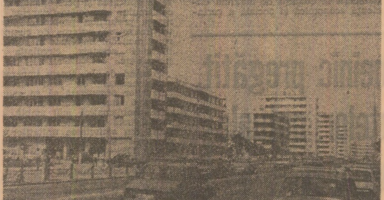
Noi blocuri de locuințe în cartierul Nufărul din Oradea.