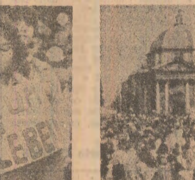
Mii de femei au luat parte la Roma la o amplă demonstratie organizată de cele trei centrale sindicale italiene...