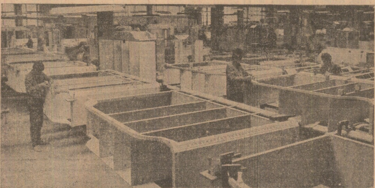
Aspect de la Combinatul de industrializare a lemnului din Focșani