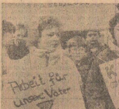
Tinere din Duisburg participante la o demonstratie impotriva somajului si lichidarii a noi locuri de munca la uzinele siderurgice din Rheinhausen...