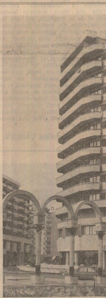
Din noua arhitectură a municipiului Alba Iulia.

Puternic stimulați de orientările și sarcinile cuprinse în Expunerea tovarășului Nicolae Ceaușescu la marile forumuri democratice din noiembrie, colectivele de oameni ai muncii din județul Brașov se află angajate cu toate forțele lor pentru realizarea prevederilor de plan pe acest an. În urma măsurilor aplicate pe linia perfecționării organizării și modernizării proceselor de producție și aplicării prevederilor programelor de creștere mai accentuată a productivității muncii și de ridicare a nivelului calitativ al produselor, un număr de 40 unități economice din județ au raportat până în ziua de 24 decembrie îndeplinirea sarcinilor de plan pe acest an la producția-marfă industrială. În același timp, alte 15 unități economice au reușit să realizeze prevederile anuale la export pe bază de declarații vamale. De asemenea, 25 de unități economice și-au îndeplinit prevederile anuale la investiții. Printre unitățile care au obținut asemenea succese se numără întreprinderea „Hidromecanică”, Regionala C.P.R., întreprinderea de articole tehnice din cauciuc, întreprinderea de stofe „Carpatex”, întreprinderea chimică Risnov, (Nicolae Mocanu).