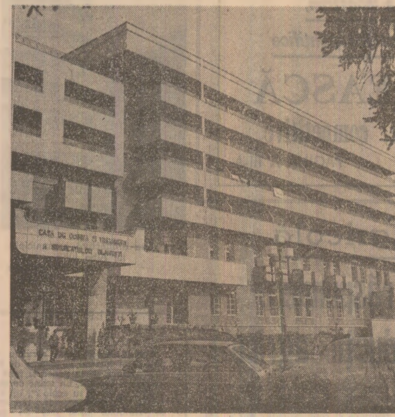
Casa de odihnă și tratament a sindicatelor din Olănești

le. În 1990, cînd toți oamenii muncii vor primi pe parcursul întregului an retribuții majorate, veniturile suplimentare se vor ridica la PESTE 29 MILARDE LEI, retribuția medie nominală urmind să ajungă la sfîrșitul cincinalului actual LA 3 285 LEI lunar, cu o creștere de 10 LA SUTĂ față de anul 1985.