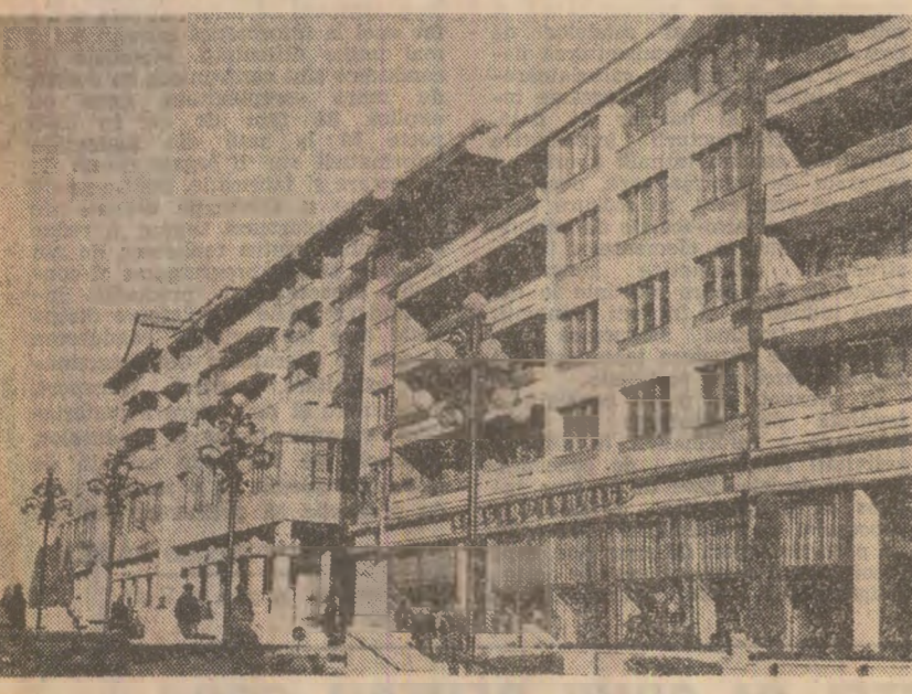
Un nou arhitectură a municipiului Suceava

— Pe cititorii noștri li-ar interesa, desigur, o asemenea... „demonstrație pe viu”? — Iată, întreprinderea noastră are în prezent un număr de 30 de colective similare din întreaga țară. Într-adevăr, în critica severă adusă de tovarășul Nicolae Ceaușescu, la recentul forum al democrației noastre socialiste, asupra imbinării muncii de partid cu munca de conducere, în general asupra situației tuturor comunităților în miza activității de inițiere a politicii partidului. Adevărul este că totul trebuie să se realizeze din afară, ci prin angajarea directă a membrilor de partid este demonstrat pe viu de numeroase aspecte concrete „anul-se” din viață, din realitățile orașului și ale întreprinderii noastre.