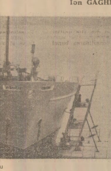
Aspect de pe Șantierul naval din Giurgiu