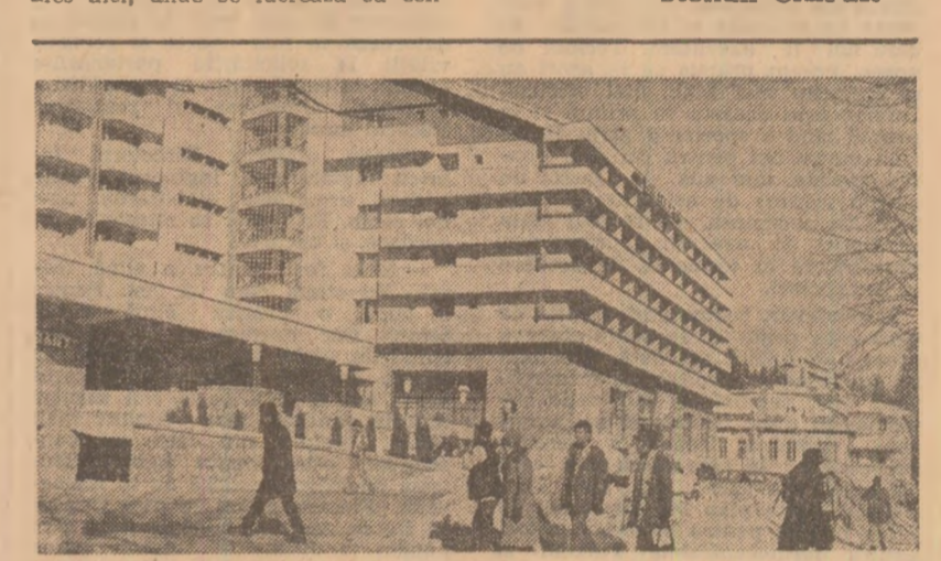
larna, la Sinaia