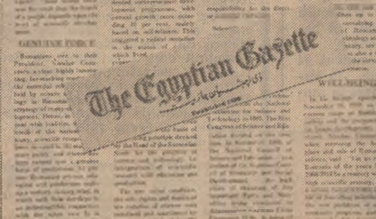
The Egyptian Gazette