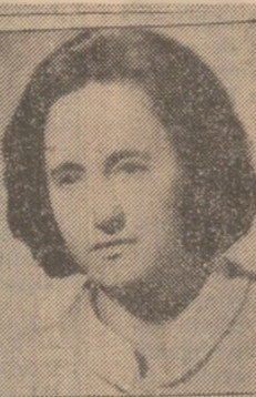
MRS. ELENA CEAUȘESCU

Elena Ceaușescu — A life devoted to development of science and peace