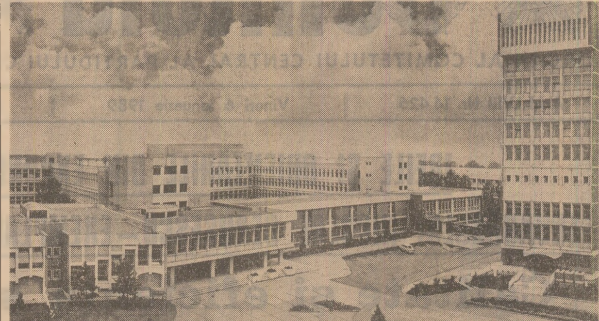
Imaginea parțială a platformei Centrului național de fizică de la Magurele