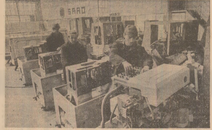
Colectivul Întreprinderii de strunguri din Tirgoviste a asimilat în fabricația de serie noi tipuri de utilaje care se remarcă printr-un înalt grad de automatizare și precizie superioară a prelucrărilor. Dintre ele se cuvin a fi menționate: strungul automat SPS-1250 și strungul automat multiax tip 3/6 mm. Pe lângă acestea, alte tipuri și modele de