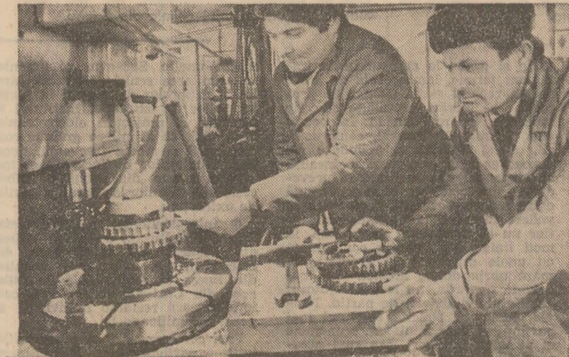
În atelierul de recondiționat piese al Stațiunii pentru mecanizarea agriculturii din Simian