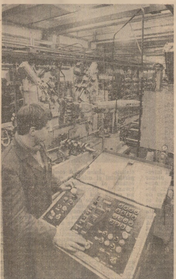
Utilaje moderne, de înaltă tehnologie, în secția motoare I-48

O analiză inițiată la mijlocul lunii mai 1988 în această secție de către comitetul județean de partid a demonstrat faptul că în decursul anilor s-au acumulat unele probleme de ordin organizatoric și tehnic, a căror rezolvare la timp a devenit o frână în calea valorificării depline a capacităților de producție și forței de muncă și, implicit, a creșterii eficienței activității productive. Analiza a arătat că dezvoltarea secției de motoare, fără corelarea exactă a capacităților de producție, a făcut ca alături de utilajele și tehnologiile de vârf introduse în ultimii ani să coexiste utilajele și tehnologiile depășite, care deveniseră un obstacol în desfășurarea proceselor de producție.