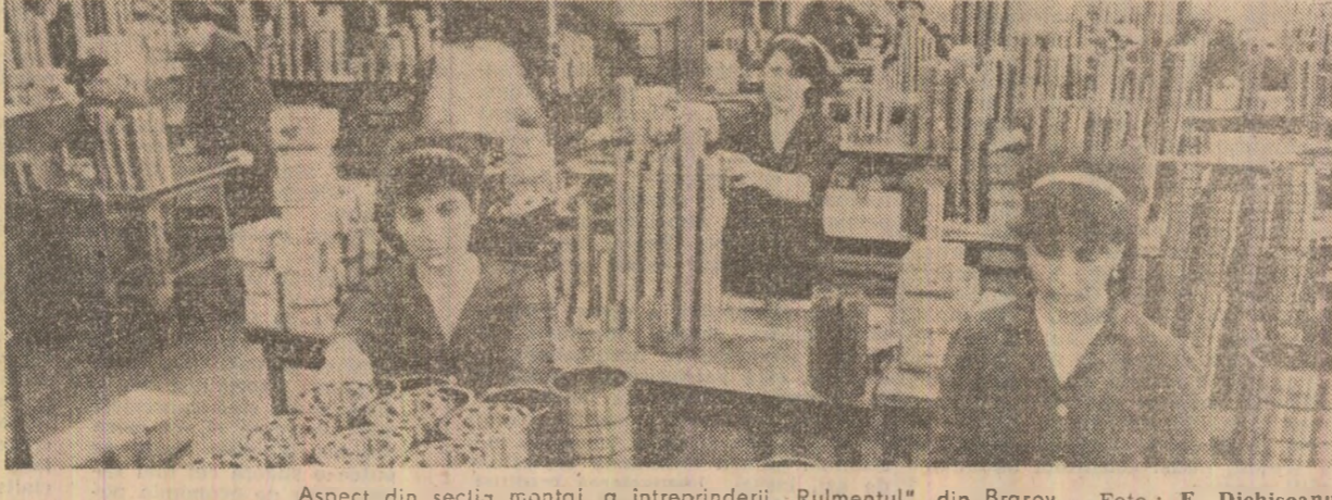
Aspect din secția montaj a întreprinderii „Rulmentul” din Brașov.

se acționează cu trei brigăzi care au în dotare săpătore de sancturi, dragline, buldozere, excavatoare, autoabsculante de mare capacitate și alte utilaje necesare.