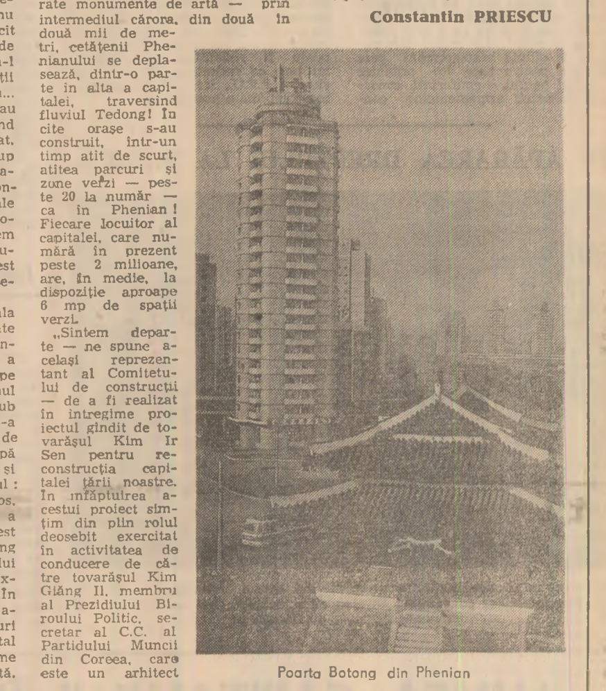
Poarta Bolong din Phenian