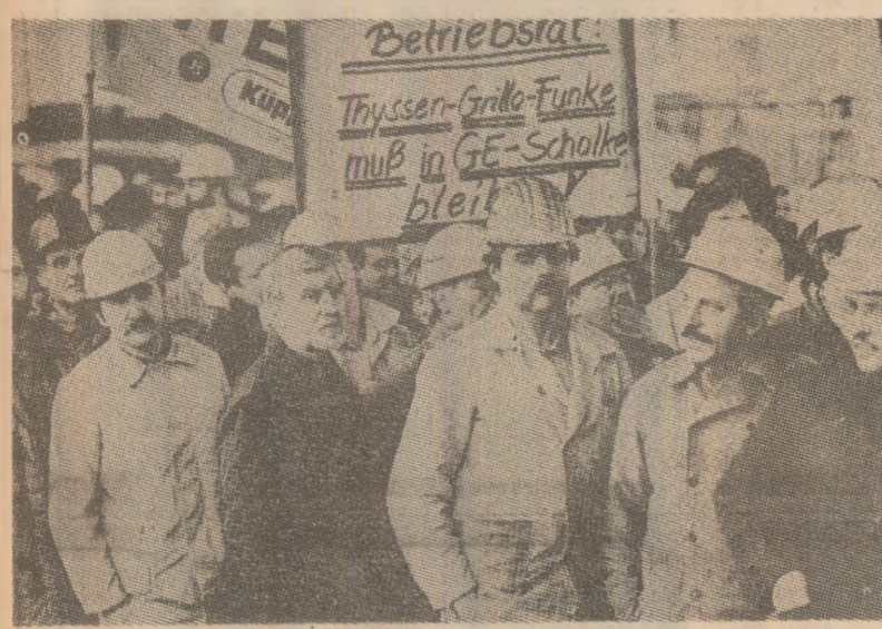
Demonstratie a muncitorilor siderurgisti din orasul Gelsenkirchen (R.F.G.) impotriva intentiilor concernului Thyssen de a desfiinta noi locuri de munca la filiala acestuia din localitate