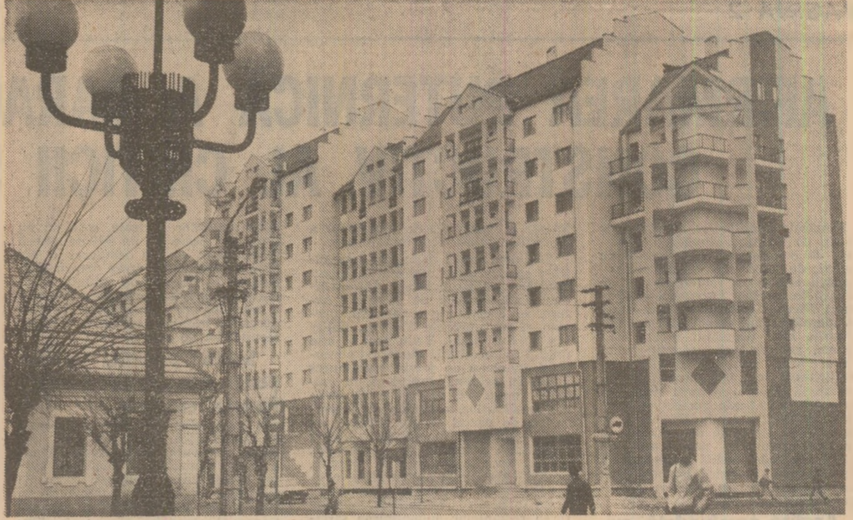
Construcții moderne în municipiul Bistrita

Practic, a fost stabilit un complex de mijloace, căi și metode de organizare științifică a producției și a muncii, completat cu un cadru juridic adecvat, de natură să permită creșterea mai accentuată a producției, a rentabilității, maximizarea beneficiului, a eficienței economice în fiecare unitate socialistă, pe baza exercitării plene a autoconducerii muncitorești și autogestiei economico-financiare.