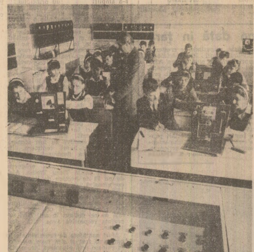
Liceul industrial nr. 1 din Cîmpina, unul dintre liceele cu profil petrolier din țară, pregătete cadre cu solide cunoștințe de specialitate pentru un sector prioritar al economiei naționale. În fotografie: elevii clasei X-a cu profilul electrotehnic în cabinetul de măsurători electrice