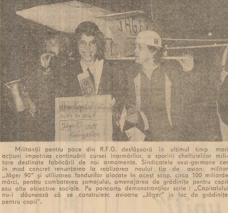
Milionați pentru pace din R.F.G. desășoară în ultimul timp mari acțiuni împotriva continuării cursei înarmării, a sporirii cheltuielilor militare destinate fabricării și noilor modele. Sindicatele vest-germane cer în mod concret renunțarea la realizarea noului tip de avion militar „Jäger 90” și utilizarea fondurilor alocate în acest scop, circa 100 miliarde mărci, pentru combaterea șomajului, amenajarea de grădinițe pentru copii sau alte obiective sociale. Pe pancarta demonstrațiilor scrie: „Capitalulul nuclear dăunează că se construiesc avioane „Jäger” în loc de grădinițe pentru copii”.