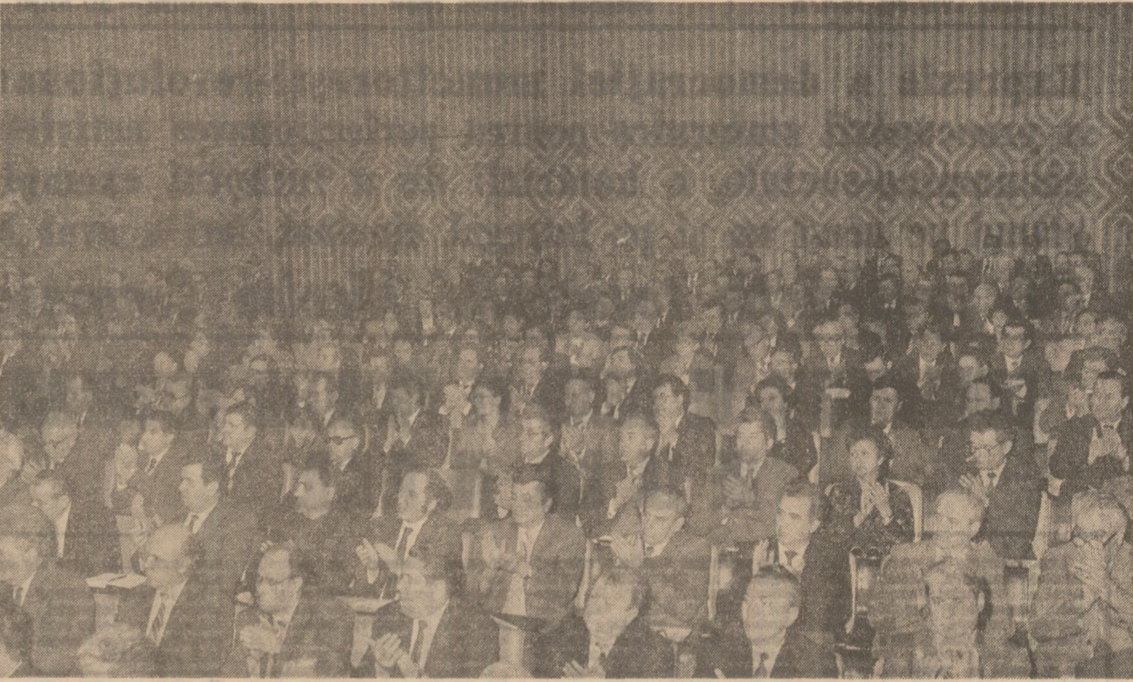
Îmbunătățirea activității în zootehnie, pentru îndeplinirea integrală a programelor de creștere a efectivelor și producțiilor animalelor, asigurarea necesarului de furaje, modernizarea fermelor zootehnice, pentru sporirea eficienței economice în acest sector important al agriculturii.

In același timp, au fost prezentate acțiunile inițiate în vederea