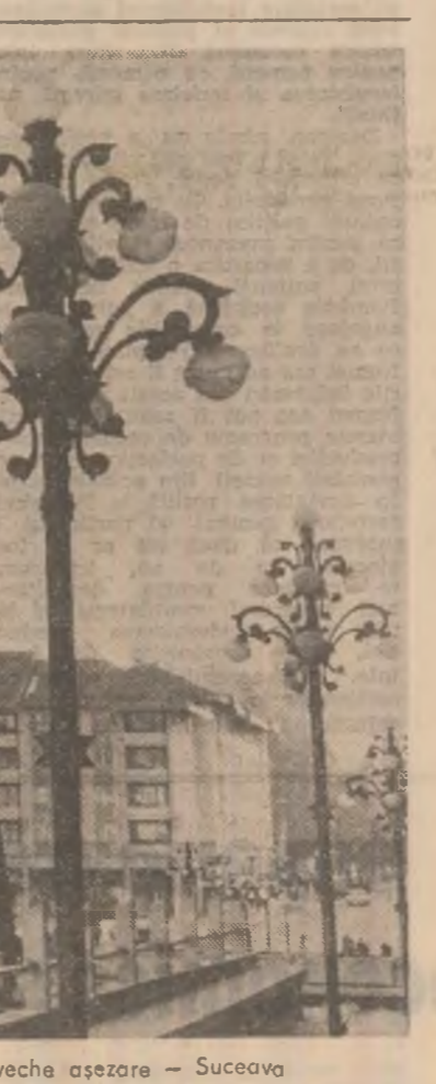
Ahitectură nouă într-o străveche așezare - Suceava

Recent, comitetul municipal de partid, consiliul popular, direcția generală comercială, împreună cu principalii furnizori de mărfuri și reprezentanți ai unor ministere au analizat comerțul bucureștean, au stabilit cîte și măsuri pentru perfecționarea activității în acest important domeniu.