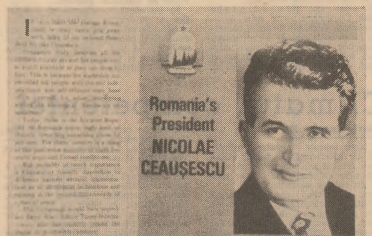
Romania's President NICOLAE CEAUȘESCU

După ce este evocată apariția recentă în Nigeria a volumului "Președintele României, Nicolae Ceaușescu, despre rolul țărilor mici și mijlocii în întărirea