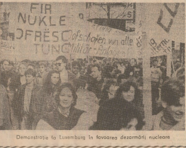
Demonstrație la Luxemburg în favoarea dezarmării nucleare