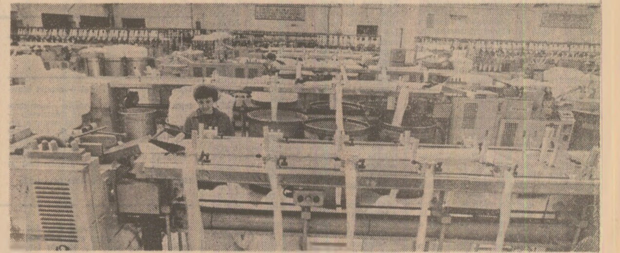
Întreprinderea Filatura de Lînă Pieptănotă Focșani. Preocupările pentru continua îmbunătățire a calității produselor reprezintă obiectiv de prim ordin al activității colectivelui de muncă de aici. În primul trimestru al anului au fost create și introduse în fabricație noi sortimente de fire cu caracteristici tehnice superioare.

„Am avut ambiție să avem un sector zootehnic bun, mai ales după ce am fost în vizită, cu clișiva ani în urmă, la unele ferme zootehnice model și am văzut ce pot realiza cooperatorii de acolo, fără să spunem că ei fac minuni. Și vacile noastre ar fi bune dacă le-am asigura hrana în condiții bune și de calitate. Cu paie și coceni, ce le dăm în prezent, vacile noastre, nu putem realiza producțiile dorite”. De fapt, șeful de fermă, care este și secretarul comi-