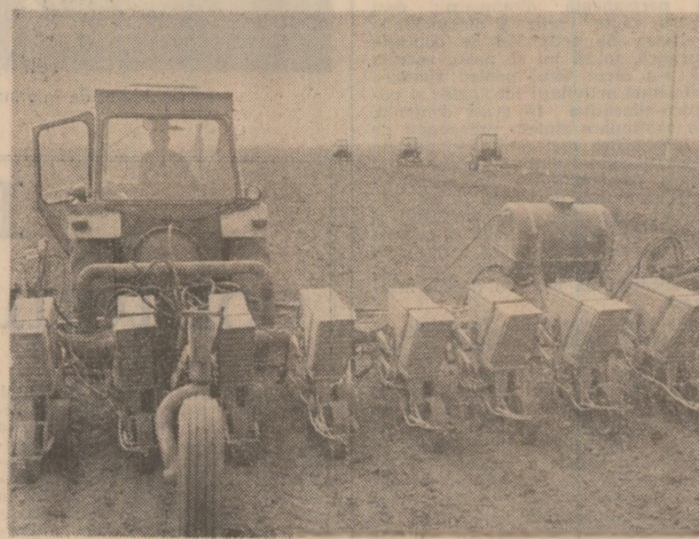
Însămînțarea porumbului la Cooperativa Agricolă de Producție Bors, județul Bihor.

„Am avut ambiție să avem un sector zootehnic bun, mai ales după ce am fost în vizită, cu clișiva ani în urmă, la unele ferme zootehnice model și am văzut ce pot realiza cooperatorii de acolo, fără să spunem că ei fac minuni. Și vacile noastre ar fi bune dacă le-am asigura hrana în condiții bune și de calitate. Cu paie și coceni, ce le dăm în prezent, vacile noastre, nu putem realiza producțiile dorite”. De fapt, șeful de fermă, care este și secretarul comi-