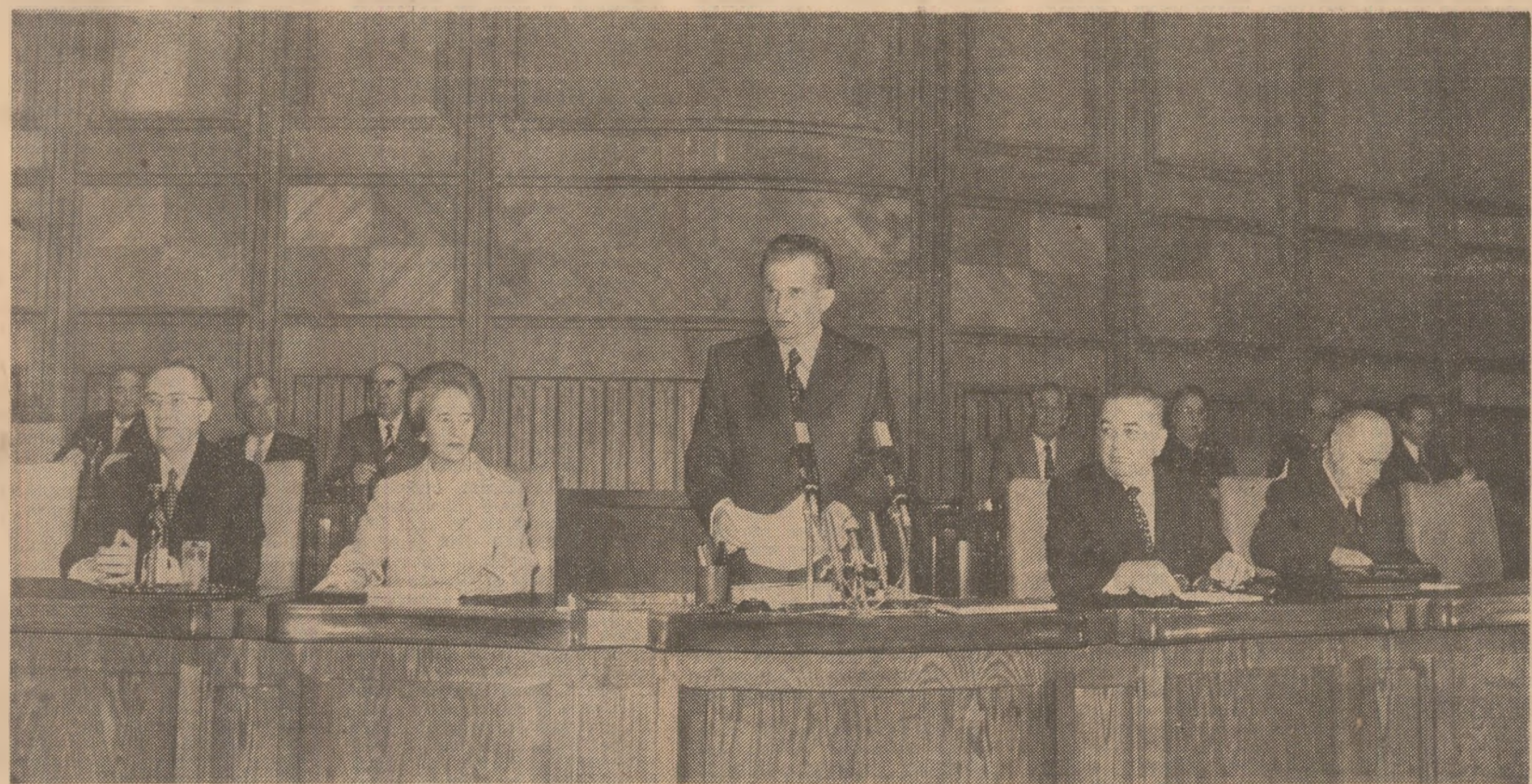
Sub președinția tovarășului Nicolae Ceaușescu, secretar general al Partidului Comunist Român, joi, au continuat lucrările Plenarei Comitetului Central al Partidului Comunist Român.