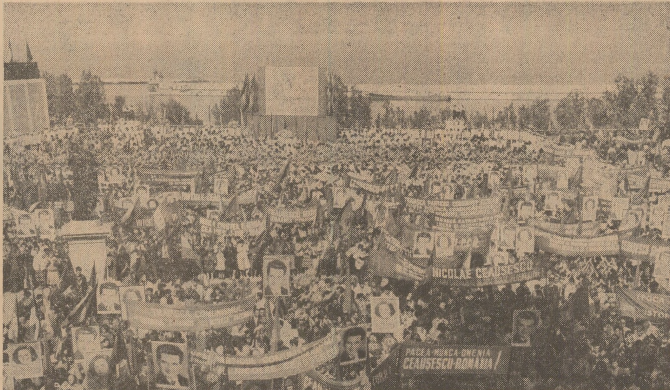
Marea adunare populară din Constanța

Asemenea marinarilor de pe celelate vase cu tricolor la câră aflate în diferite puncte ale globului, echipajul navei „Baia Mare” și-a manifestat sponda mare bucurie și profundă mândrie patriotică față de vestea aflată pe calea undelor, pe drumul de întoarcere spre țară, că, pentru prima dată în istoria sa, România nu mai are nici o datorie externă, noi mai plătește tribut nimeni și este pe deplin independentă economic și politic. La această impresionantă adunare populară ne prezentăm