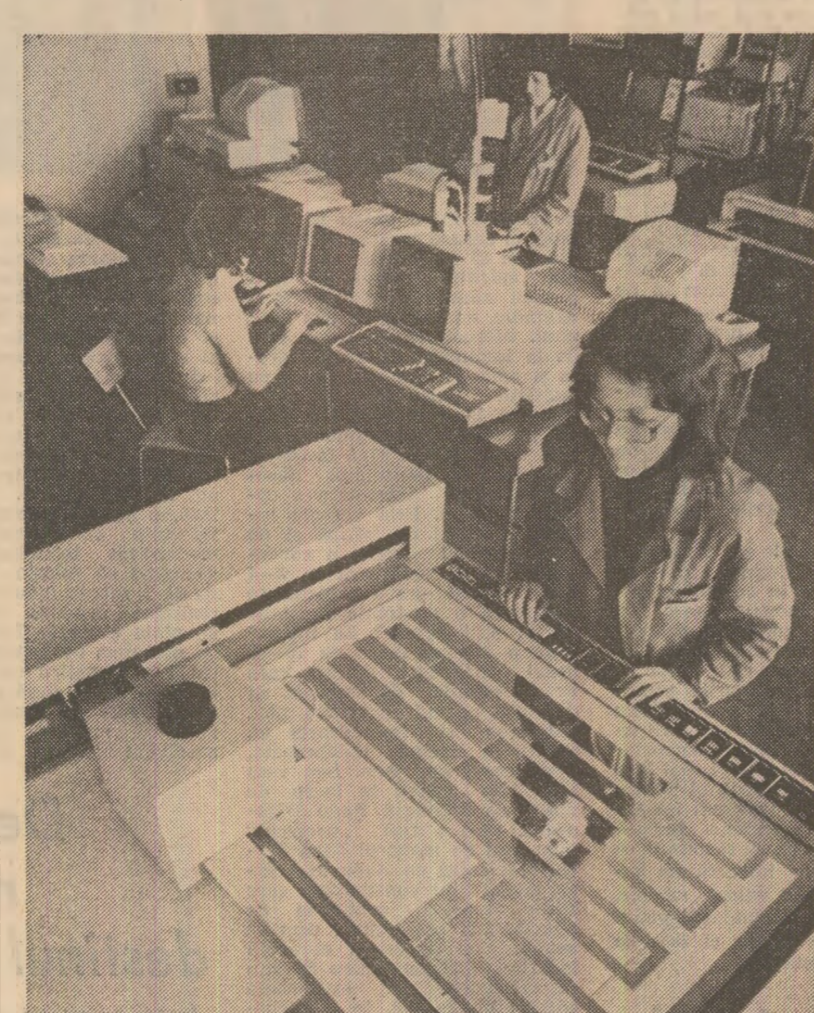
I.M.G. București. În atelierul de proiectare asistată de calculator se execută desenele unui nou agregat destinat turnării pieselor de mare complexitate tehnică pentru utilajele energetice ce se fabrică în întreprindere

Gheorghe GIURGIU corespondentul „Științei”