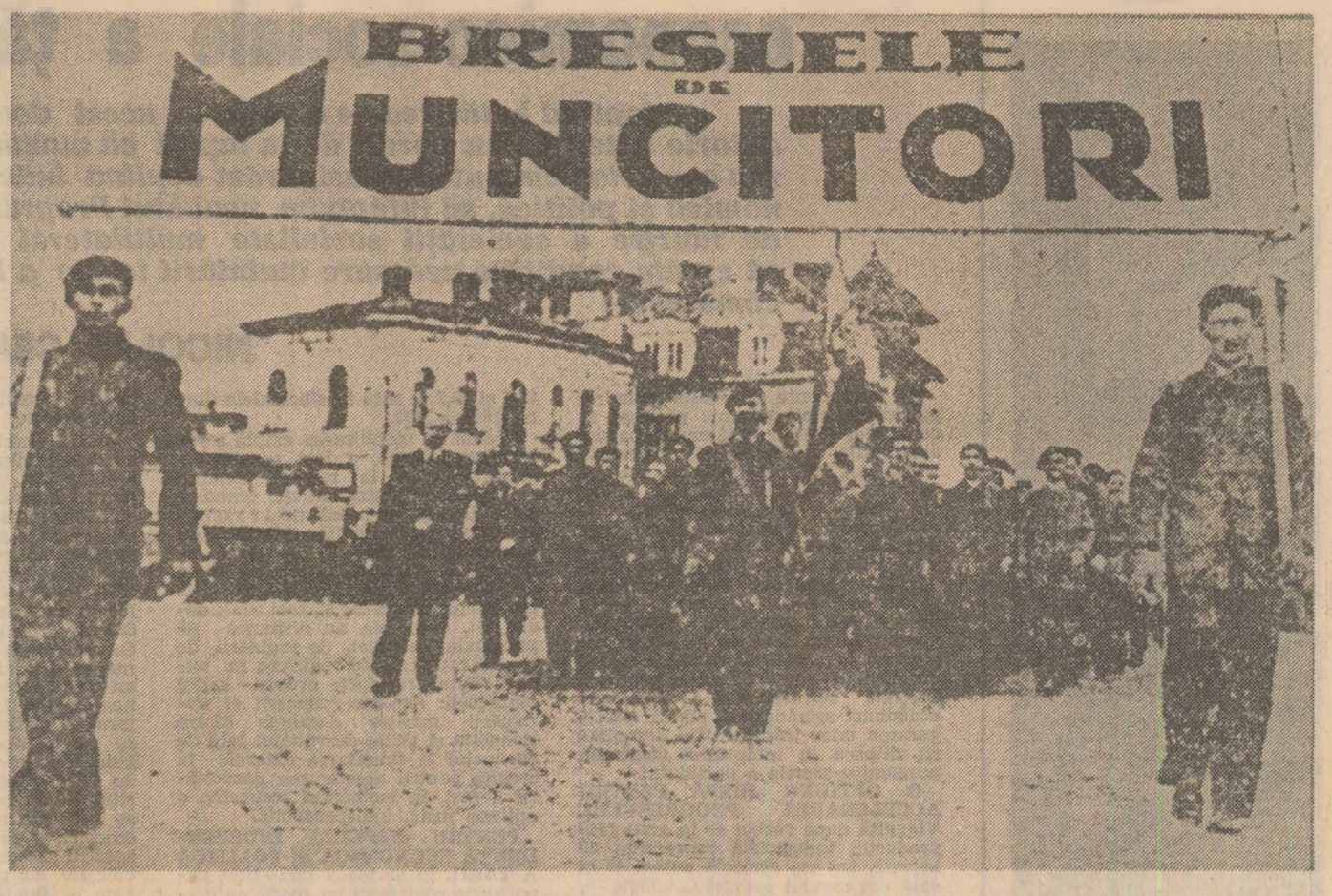
1 Mai 1939 : grup de muncitori organizați în bresle demonstrînd în Capitală

— Cum se explică faptul că, în cluda tineretii, sînt mereu printre frunțasi? — Nu „în cluda tineretii”, ci, credem noi, „datorită tineretii”. Simplu: printr-o permanență și responsabilitate deschise spre nou, iar noul, la noi, este mereu la ordinea zilei. Ba uneori chiar și a... orolilor. Ei însuși, în primul rînd, o necesitate înnoire a producției — sîntem doar o unitate care pro-