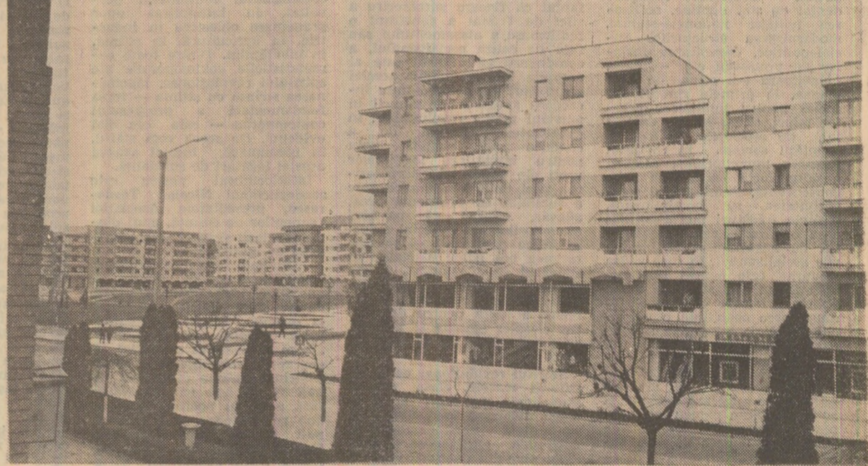
Arhitectură nouă în orașul Tîrgu Frumos, județul Iași

Într-un articol publicat în „Scinteia” din 11 aprilie, anul acesta, relatam despre punerea în funcțiune a mina Zeguziani din județul Mehedinți — a unui abataj cu cel mai lung cîmp de exploatare — 1000 metri liniari. Evidențiam cu deosebită recordanță atins în luna martie la ritmul de înaintare în stratul de cărbune: 174 de metri. Pentru luna aprilie, deslucim mineri de aici și-au propus să depășească propriul record, adică să realizeze o viteză de înaintare de 180 de metri. În cinstea zilei de 1 Mai, harnicul colectiv de muncă raportează un bilanț frumos realizat, care s-au obținut prin abnegație muncitorească: în luna aprilie s-a realizat o viteză de înaintare în stratul de cărbune de 210 metri. De la începutul anului și pînă în prezent s-au extras peste plan 35000 tone cărbune. Menținînd aceleași ritmuri înalte de extracție, minerii de la Zeguziani și-au luat amănuntul ca în cinstea celor două mari evenimente — cea de-a 45-a aniversare a actului istoric de la 23 August 1944 și cel de-al XIV-lea Congres al partidului — să dea țării o producție suplimentară de 80000 tone cărbune. (Virgiliu Tătaru).