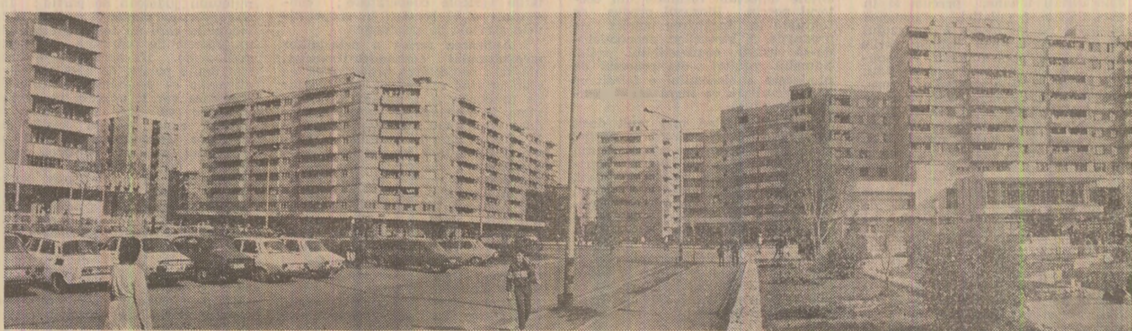
Noi construcții de locuințe în municipiul Oradea