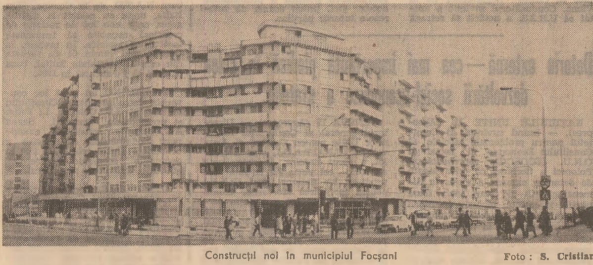
Construcții noi în municipiul Focșani

colaborare statornică între România și Mongolia și s-a exprimat dorința de a se acționa pentru dezvoltarea lor în continuare, în interesul ambelor țări și popoare, al cauzei păcii și înțelegerii între națiuni.