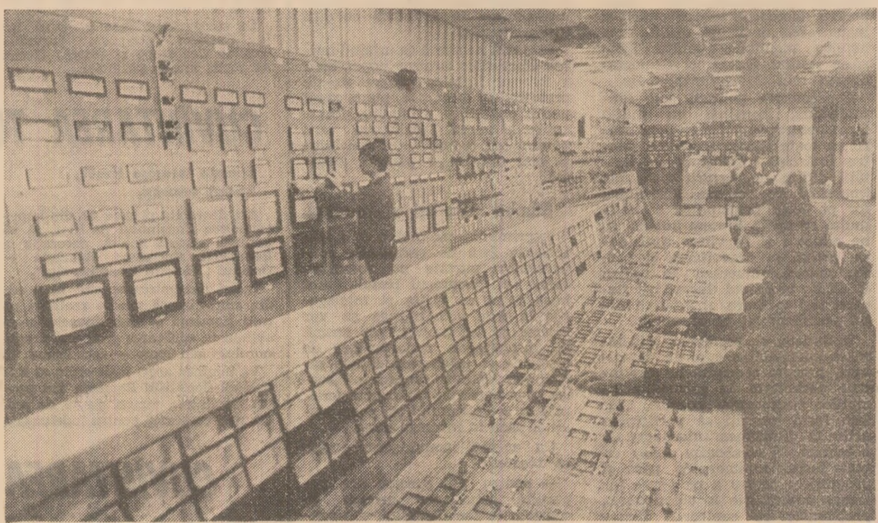
Centrala electrică de termoficare Oradea II. Aspect din camera de comandă a grupului energetic nr. 2, de 50 MW.