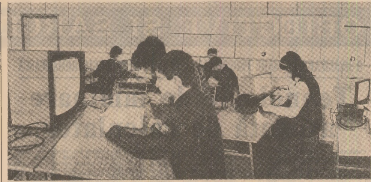
În laboratorul de calculatoare al Liceului de Matematică-Fizică nr. 1 din Iași.