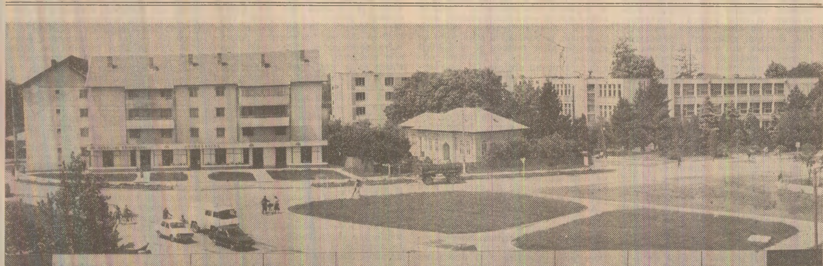
Coordonate urbane la Bolintin-Vale