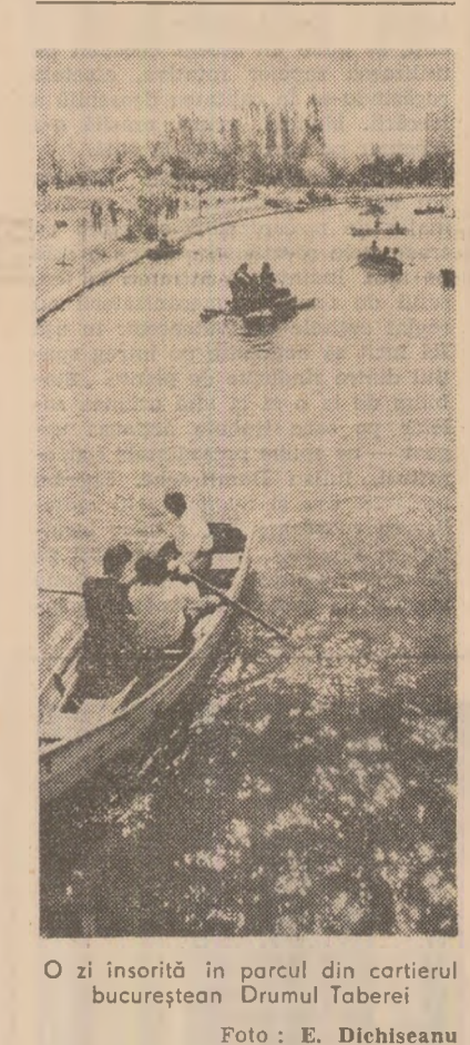
O zi însorită în parcul din cartierul bucurestean Drumul Taberei.

Finalizarea a unui ciclu de învățămînt, lucrările practice de bacalaureat reprezintă o expresie adecvată a nivelului de pregătire a absolvenților în meseria aleasă. În toate liceele — în cabinete, laboratoare, ateliere școlare — pot fi văzute lucrări semnate de foști elevi, adesea de o utilitate apreciabilă, modele de urmat pentru colegii lor mai mici. Multe dintre aceste aparate, machete functionale, instalații care reproduc, comisiile de creație tehnico-științifică, cercurile inovatorilor și inventatorilor, comisiile inginerilor și tehnicienilor, brigazile artistice, deși în județ, într-o serie de întreprinderi sînt experiențe bune în toate aceste domenii ale muncii politico-educative și cultural-artistice. În urma controlului, așa cum aveam să ne spună unele cadre de partid, membri ai consiliului județean de cultură și educație socialistă, s-a înțeles că trebuie să se acționeze cu mai multă răspundere, cu inițiativă pentru ca munca politico-educativă să răspundă peste tot cerințelor producției, educației multilaterale a oamenilor muncii.