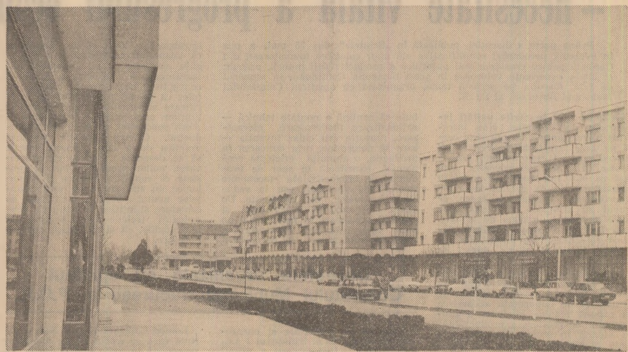
Arhitectură nouă, modernă în vechiul oraș Hirliu, județul Iași

Cu acest prilej, tovarășul Nicolae Ceaușescu a acordat un interviu pentru cotidianul „Al Wahda News”.