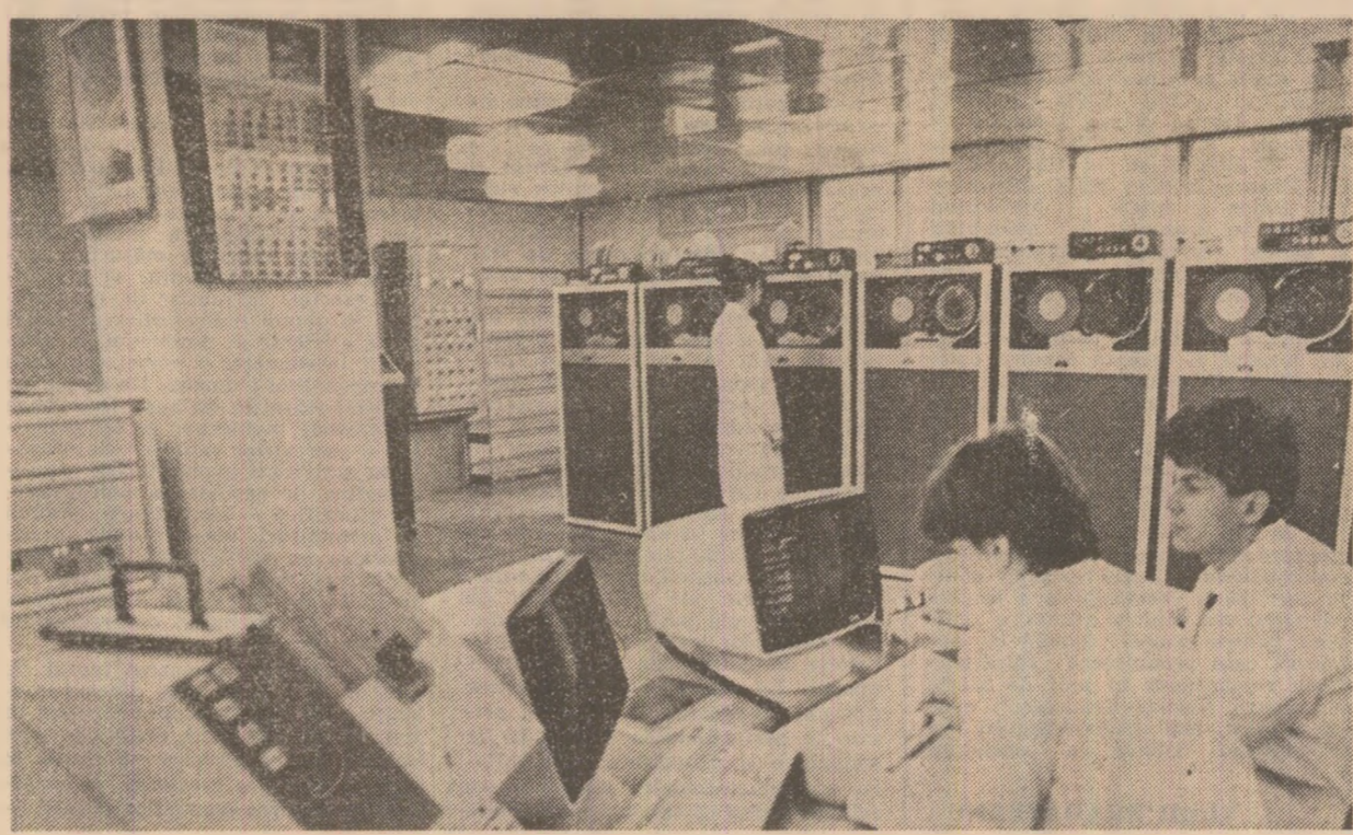
Oficiul de calcul devine un „instrument” tot mai activ în activitatea economică de la Intreprinderea de Scule și Elemente Hidraulice din Focșani. În ultima vreme, în acestor unități s-au intensificat preocupările pentru a se trece pe scară mai largă la proiectarea asistată de calculator.