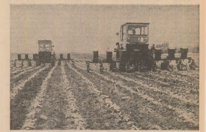
Se lucrează intens la întreținerea culturilor

O amplă mobilizare de forțe la prașitul culturilor constatăm la Cooperativa Agricolă Inca. La cea de-a doua prașia manuală la porumb participau nu numai coopera-