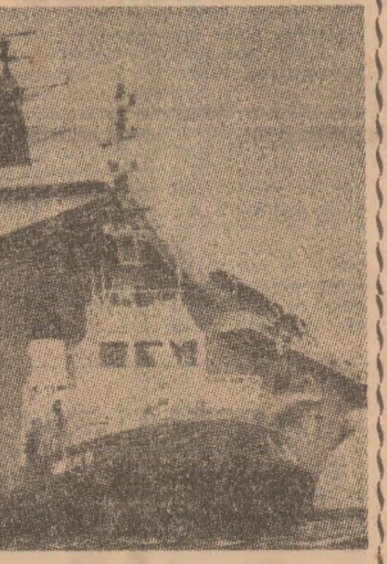
Membrii organizației „Greenpeace”, care luptă pentru apărarea mediului ambiant, au protestat viguros împotriva recentei intrări a portavionului englez „Ark Royal” în portul vest-german Hamburg. Din șalupa pe care au înconjurat nava, protestatarii au ridicat un vast panou pe care scria : „Prudență ! Arme nucleare la bord”