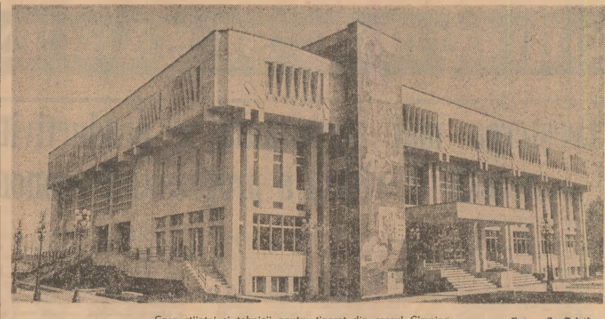
Casa științei și tehnicii pentru tineret din orașul Cimpino

traditionale existente în exercitarea unor meserii și profesii, dezvoltarea la elevi a motivației superioare pentru pregătirea și încadrarea în profesii direct productive, în special din domeniile prioritare, cunoașterea elevilor și spiritul procesului de autocunoaștere, pregătirea lor psihologică pentru a opta în mod conștient, liber pentru viitoarea școală și profesione, pe baza cunoașterii particularităților individuale proprii, a cerințelor social-economice. Practica dovedește că nimic nu-l poate învăța pe elev mai bine ce înseamnă munca decît înșasi activitatea practică în care este antrenat. Nu întimplător ne preocupăm stăruitor de dotarea școlilor cu atelieri asemănătoare celor din întreprinderi, de desfășurarea muncii