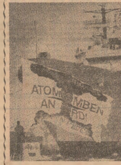
Membrii organizației „Greenpeace”, care luptă pentru apărarea mediului ambiant, au protestat viguros împotriva recentei intrări a portavionului englez „Ark Royal” în portul vest-german Hamburg. Din șalupa pe care au înconjurat nava, protestatarii au ridicat un vast panou pe care scria : „Prudență ! Arme nucleare la bord”