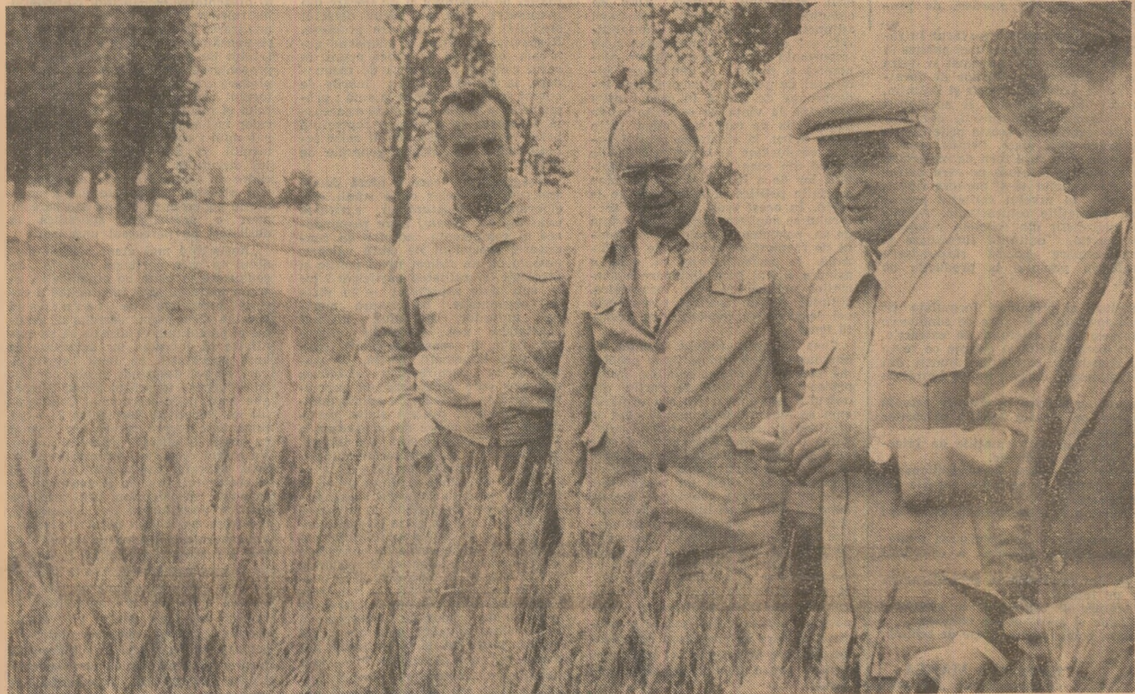
Tovarășul Nicolae Ceaușescu, secretar general al Partidului Comunist Român, președintele Republicii Socialiste România, a efectuat, duminică, o vizită de lucru in unități agricole de stat și cooperatiste din Sectorul agricol Ilfov, din județele Ialomița și Călărași.

a efectuat o vizită de lucru in unități agricole din Sectorul agricol Ilfov, din județele Ialomița și Călărași