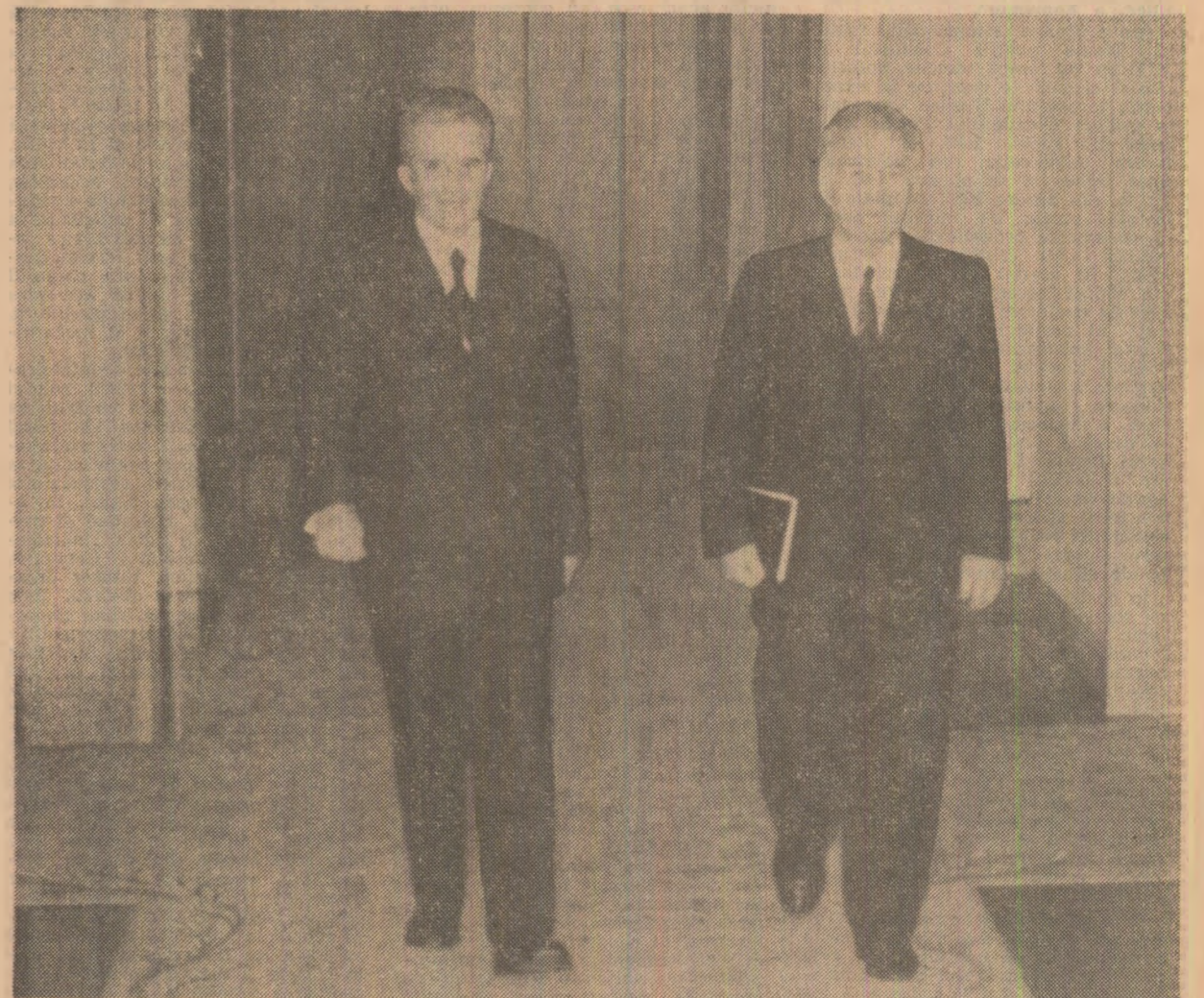
Cu prilejul participării la Consfătuirea Comitetului Politic Consultativ al statelor participante la Tratatul de la Varșovia, sîmbătă a avut loc o întîlnire între tovarășul Nicolae Ceaușescu, secretar general al Partidului Comunist Român, președintele Republicii Socialiste România, și tovarășul Rezső Nyers, președintele Partidului Muncitoresc Socialist Ungar.