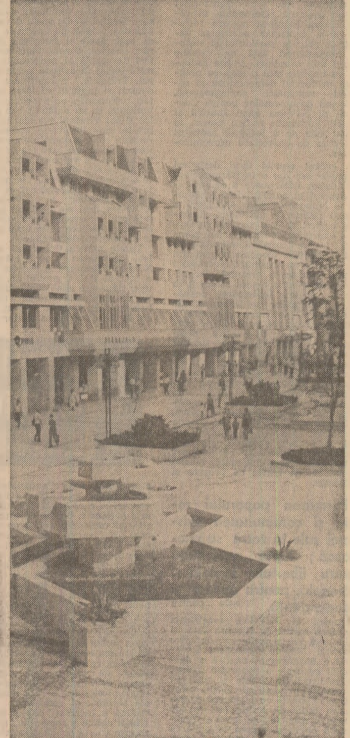
adevăr: drumul spre oraș al țărânului român este astăzi un drum spre urbanizare, un drum al progresului și bunăstării. Nu numai în localitățile rurale ale județului Teleorman s-a construit mult în vremea din urmă; nu numai acestea și-au schimbat înfățișarea. Grijă pentru ameliorarea condițiilor de trai ale țărânilor a avut în vedere toate așezările rurale ale patriei.

În 1968, cînd a fost pe pînă la ușa primul autoturism românesc, existau la Colibași în jur de 60 de apartamente. Acum sînt 9.200. S-a construit mult și din ce în ce mai bine, mai frumos, în ultimii ani. Săluț spectaculos, pentru care nu există practic termeni de comparație, se poate regăsi aproape pretutindeni în România ultimului sfert de veac. Să exemplificăm: în Alexandria, în anul 1968, existau 48 de apartamente; cele peste 14.000 construite de atunci și pînă în prezent au schimbat înfățișarea localității. În municipiul Buzău există astăzi de peste 20 de ori mai multe apartamente decît erau în 1965. La Craiova numărul locuințelor a crescut vertiginos. Creșteri fără precedent s-au înregistrat și la Slobozia, Drobeta-Turnu Severin, Oradea - și periplul pe harta țării poate continua.