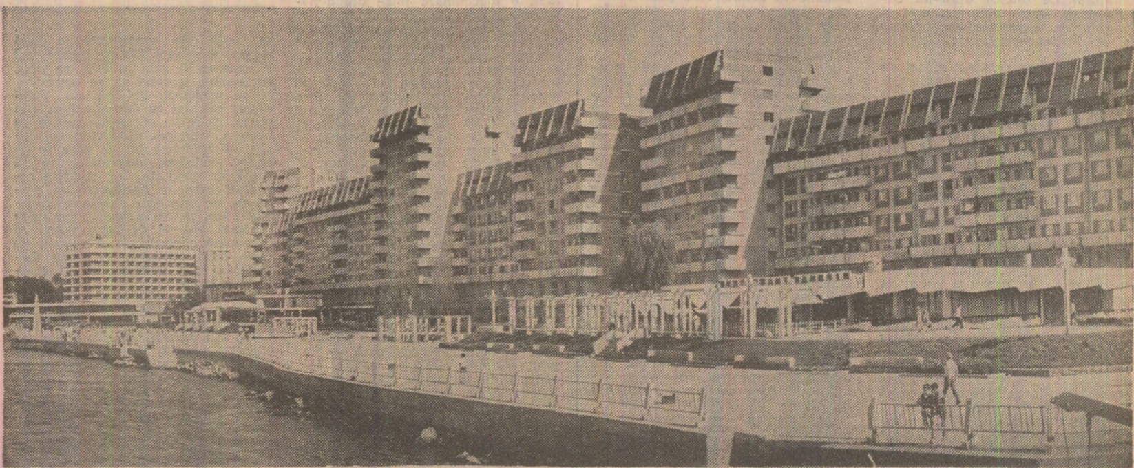
Noi construcții de locuințe în municipiul Tulcea

Oamenii muncii din județul Constanța își sporesc eforturile pentru a împlini marea sărbătoare de la 23 August și Congresul al XIV-lea al partidului cu noi și semnificative succese. În toate unitățile economice au fost inițiate acțiuni menite să contribuie la creșterea productivității muncii, valorificarea mai eficientă a materialelor și materiilor prime, realizarea unor produse de calitate superioară. Printre întreprinderile cu cele mai bune rezultate în îndeplinirea planului și creșterea eficienței economice se numără Întreprinderea Electrocentrale Constanța, Întreprinderea-Întreprindere de Construcții Hidrotehnice Portuare, Centrăla-Antrepriză Generală de Construcții Hidrotehnice Constanța, Întreprinderea Mineră „Dobrogea” și altele. (Lucian Cristea).