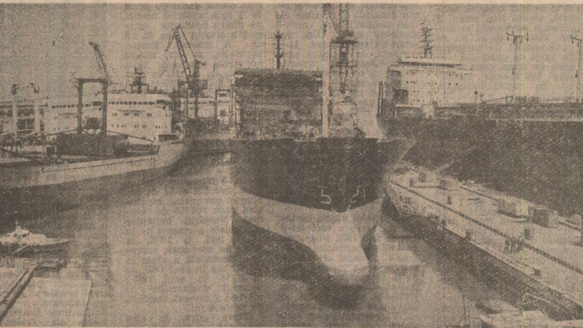
Imagine de pe Şantierul Naval din Galaţi

— Cum se trăieşte viaţa la temperatura asta? — Repede şi... deplin. — 270 de comunisti meseriaşi cu îndelungă experienţă — se află în „locurile-cheie" de producţie ale bazei. Cei mai mulţi, formaţi aici. Foar-