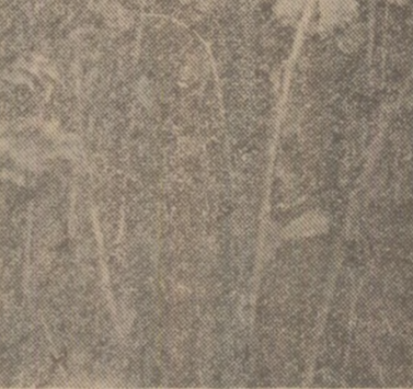
TULCEA: Noi tipuri de nave

După efectuarea probei de mare, nava „Miercurea-Cluj”, cargo de 8.750 taw cu motor lent, prima din seria celor aflate în prezent în fabrică la Întreprinderea de Construcții Nave și Utilaje Tehnologice din Tulcea, a fost predată beneficiarului. Paralel cu această importantă realizare a tinerilor navalisti tulcei se execu-