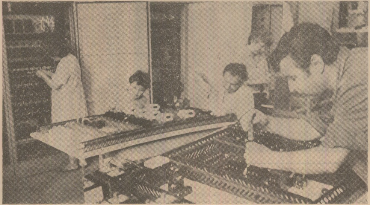
Întreprinderea „Automatică” din Capitală. Aspect din secția montaj general

Semnificativ este faptul că toate aceste succese au fost obținute ca urmare a îndeplinirii măsurilor cuprinse în programele de modernizare, a aplicării în producție a unor tehnologii noi de înaltă productivitate. Demn de subliniat faptul că, concomitent cu îndeplinirea și depășirea planului, la nivelul Capitalei s-au economisit 22.900 tone metal, 24.800 tone combustibil convențional, 23.567 MWh energie electrică.