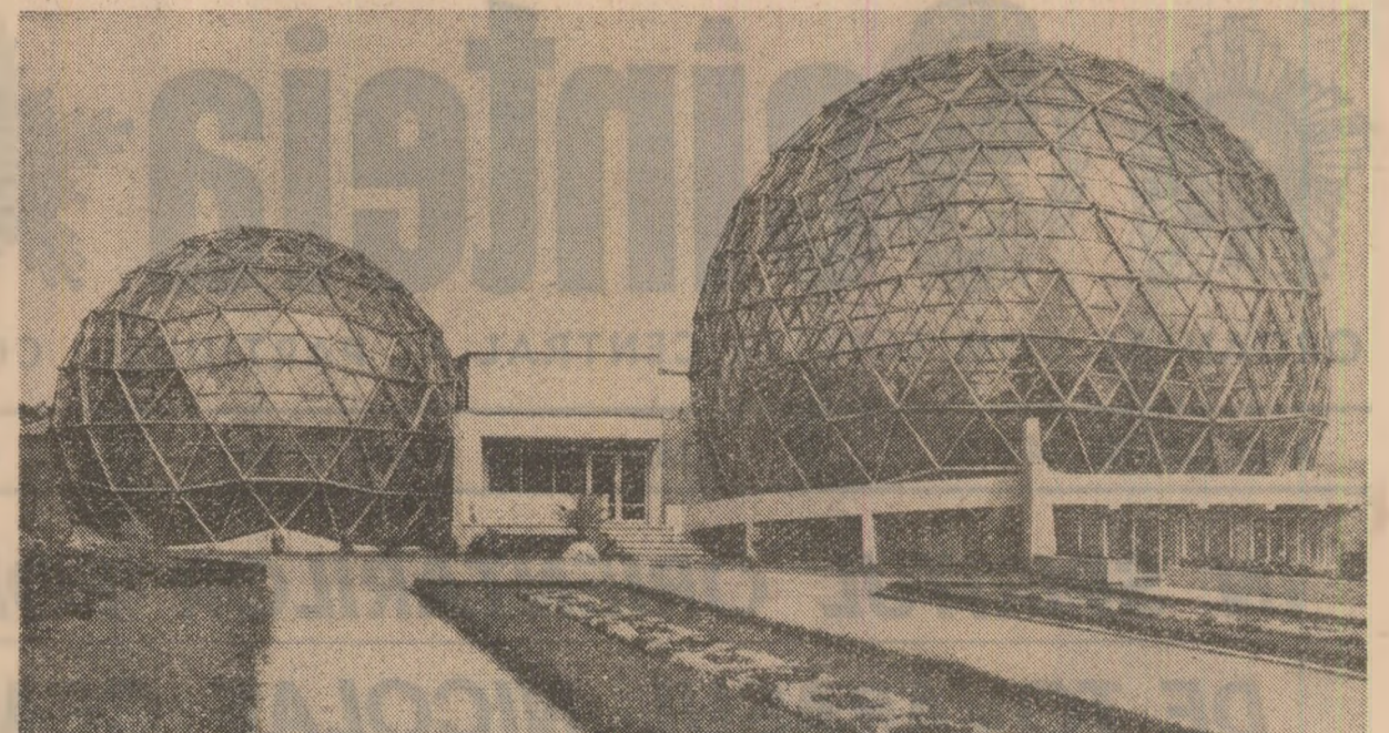
Serele grădinii botanice din Jibou, județul Sălaj

în prezent programul de dezvoltare economică-socială a localității pentru ca, cel mai târziu până în luna octombrie, așa cum a indicat secretarul general al partidului, să-l prezentăm acest program cu oamenii, să-l definim și să-l aprobăm în organul local al puterii de stat. În La Plenara din 27-28 iulie a.c. la Comitetul Central al P.C.R., secretarul general al partidului releva cu pregnanță că: „O atenție deosebită va trebui să acordăm în continuare, înființării fermei de poliflori parțiale și statului cu privire la apărarea și păstrarea mediului inconjurător. Îndeosebi va trebui asigurată îndeplinirea riguroasă a programelor naționale de combatere a eroziunii solului și înfrumusețarea și împăduririi, de combatere a poluării și păstrarea curată a apelor, a mediului inconjurător în general”. În spiritul acestor exigențe a fost elaborat și Legământul deosebit al P.C.R. în privința apărării și păstrării mediului inconjurător, care a fost aprobat la ultima sesiune a Marii Adunări Naționale. „Din experiența aplicării măsurilor de protecție a mediului inconjurător, în țara noastră rezultă că problema din acest domeniu sînt examinate și rezolvate la nivelul întregii societăți într-o perspectivă vastă, cu participarea întregii populații, în scopul depășirii și controlării surselor de poluare și al înfrumusețării și largii game de măsuri.