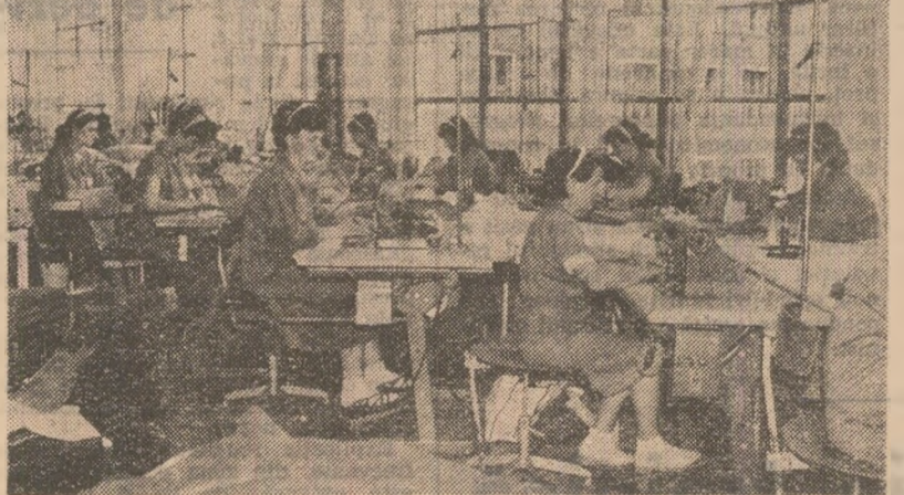
Aspect de muncă de la întreprinderea de Confecții „Mondiala” din Satu Mare