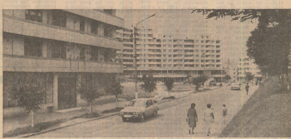
Cortierul „Deul florilor” din Orașul Dej