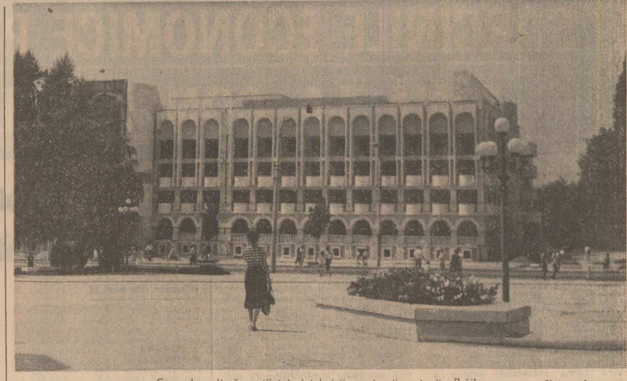
Casa de cultură a științei și tehnicii pentru tineret din Brașov

strănată care a infierat și condamnat dictaturile și un nou și brutal act de agresiune și samovolnică fascistă. Guverne, oameni de stat, posturi de radio, cotidiane și agenții de presă, oameni de știință și cultură s-au pronunțat împotriva dictatului impus României prin forță, declarând că nu-l vor recunoaște nicodată. Astfel, exprimându-și dezacordul față de actul samovolnic de la Viena, premierul britanic Winston Churchill prezintă „un volum recunoscut și achiziționat teritorial care s-a produs în timpul războiului, în afară de cazul cind s-ar fi făcut cu concursul și voința părților interesate”. Dictatul fascist de la Viena n-a fost recunoscut nici de guvernul S.U.A., stă în cale propagandă revisionistă horthystă a deșus susținute eforturi pentru captarea opiniei publice și a unor personalități politice și a unor teritorii recunoașterea nollor teritorii anexate. Administrația condusă de președintele F. D. Roosevelt a respins agitațiile revisioniste horthyste și pretențiile Ungariei asupra Transilvaniei și a altor teritorii aparținând statelor vecine. Dezvăluind în fața opiniei publice din S.U.A. în anul cel de-al doilea război mon-