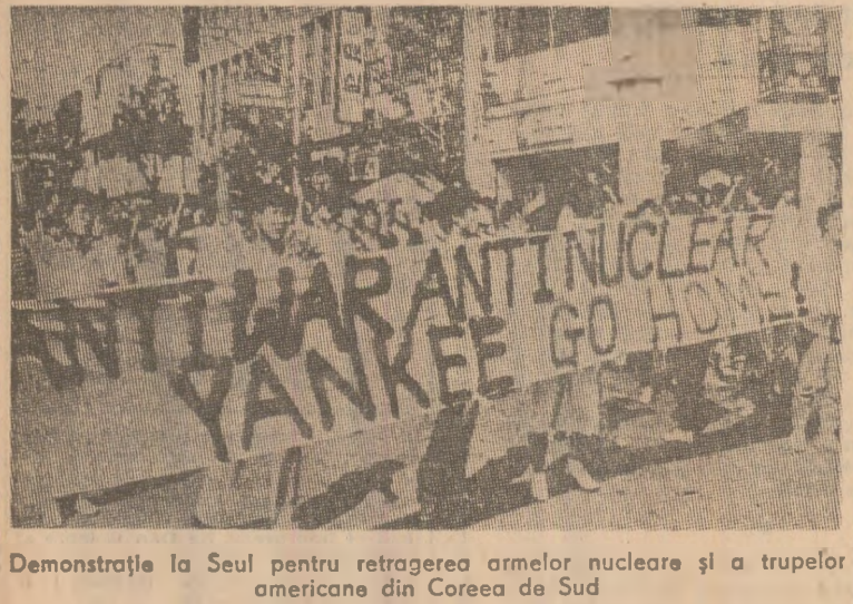
Demonstrația la Seul pentru retragerea armelor nucleare și a trupelor americane din Coreea de Sud

nucleare „Trident-2”, care urmează să facă parte din flota S.U.A.