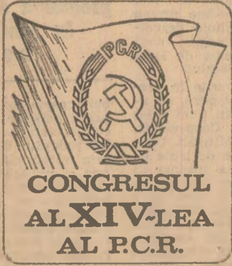
CONGRESUL AL XIV-LEA AL P.C.R.