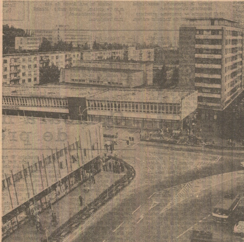
Orăşele patriei într-o continuă modernizare şi înfrumuseţare. Imagine din municipiul Pietra Neamţ.

Viorica STANCIU testatorie, întreprinderea „Textilia” Slatina, judeţul Olt