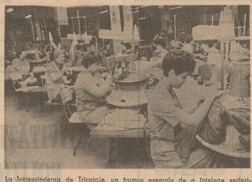
La Întreprinderea de Tricotaje, un frumos exemplu de a înțelege seriositatea în muncă și în schimbul II, volumul producției realizate zilnic este peste nivelul planului

— Si asemenea justificări care nu folosesc la nimic, atît timp cît, datorită unor neglijențe mărunte, se îrosește un prețios timp productiv,