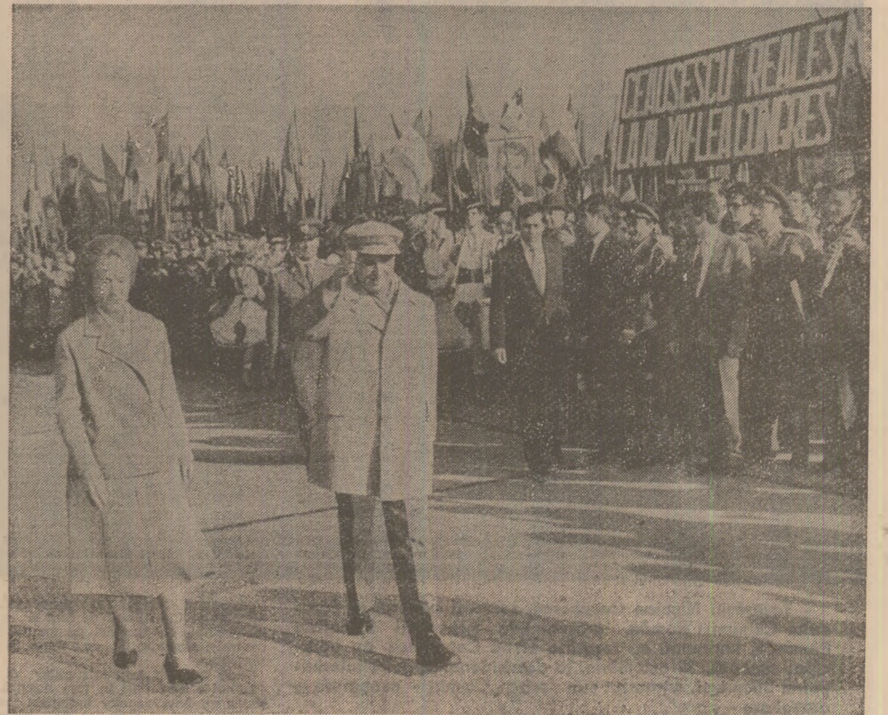
Tovarășul Nicolae Ceaușescu, secretar general al Partidului Comunist Român, președintele Republicii Socialiste România, împreună cu tovarășa Elena Ceaușescu au făcut, în drum spre județul Bistrița-Năsăud, o escală în municipiul Cluj-Napoca.

Locuitorii orașului au întâmpinat pe tovarășul Nicolae Ceaușescu și tovarășa Elena Ceaușescu cu căldură și însoțire. Mă de oameni ai muncii au venit pentru a exprima sentimentele de profundă stimă și prețuire, întreaga lor recunoștință pentru tot ceea ce a făcut și face spre binele și prospăritatea patriei, înfiorarea necentenită a României socialiste.