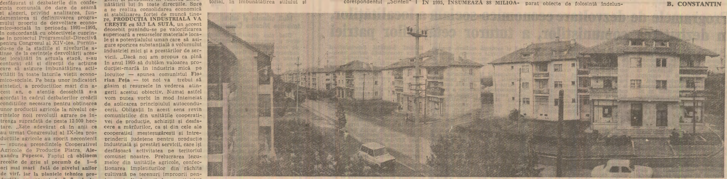
Arhitectură nouă, modernă, blocuri cu apartamente confortabile în comuna Balotești, din Sectorul Agricol Ilfov