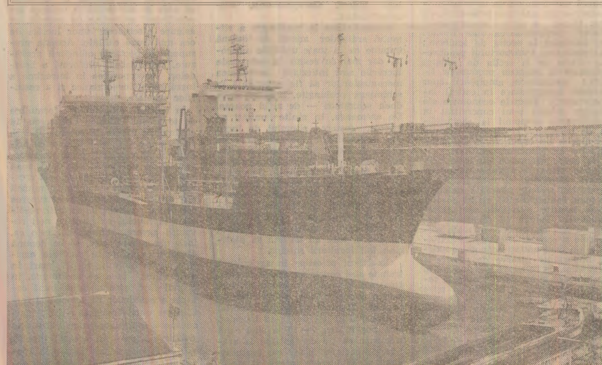
Pe Șantierul Naval Galați

guri și tot cu forțe proprii să reorganizăm și spațiile de producție, solicitând numai sprijinul strict necesar din partea unităților de profil: 3) Schimbările trebuiau să se producă „din mers”, într-o succesiune firească, imobilizând cel mai puțin activitatea sectorului de producție, pentru că sarcinile de plan nu ne-au lăsat nici o clipă, nu au admis nici o diminuare a dinamicii indicatorilor tehnico-economici.