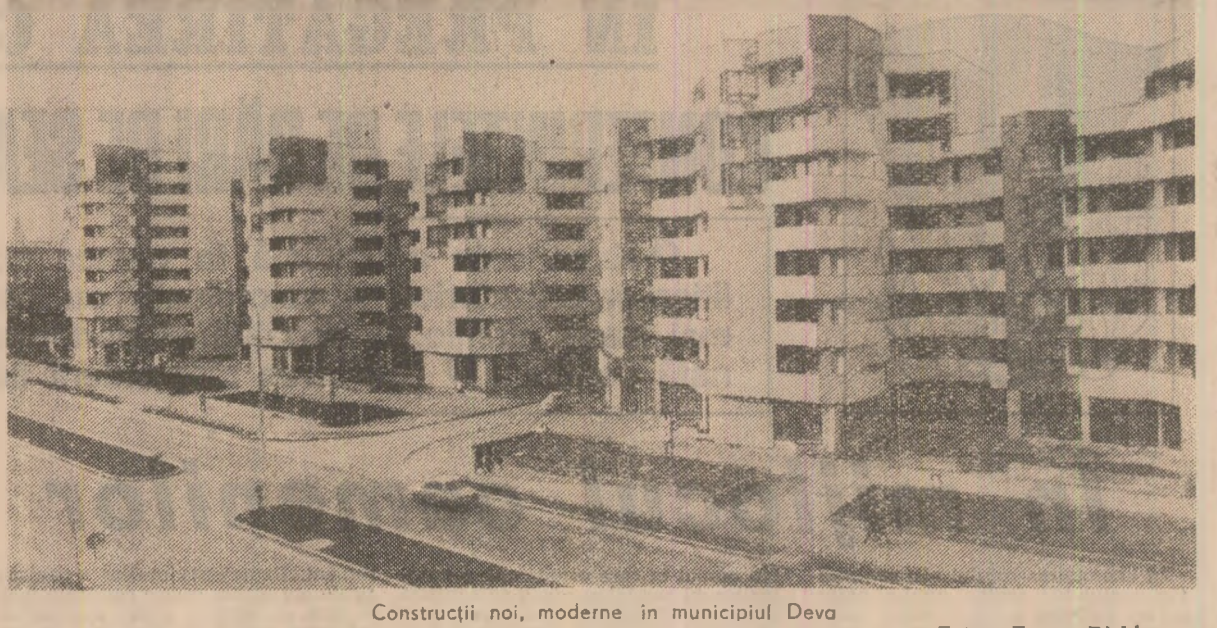
Construcții noi, moderne în municipiul Deva

toare de cercetători nu așteaptă comenzi, sugestii, idei de la beneficiarii, ci investighează realitatea și își însușesc rezultatele în mod hotărîtor. Exemplul studiului realizat de filiala noastră, cu un timp în urmă, în sectoarele calde din 30 de întreprinderi, soldat cu un sistem de comandă perfecționat pentru electroizolarea de oțel, a fost un exemplu în cazul combinatului nostru, noua calitate a muncii înseamnă, înainte de toate, produse mai multe și mai bune. Cum? Prin organizarea mai bună a folosirii instalațiilor, prin reducerea pierderilor tehnologice, prin disciplină muncitorească, conștință mai înaltă și, în orice caz, prin încurajarea activității de invenții și inovații. Numai în primul semestru au fost aplicate 54 de invenții, cu o valoare de peste 9 milioane lei, iar alte 17 stînt pe cale de a fi aplicate. Unele privesc produse care vor influența direct sau indirect calitatea vieții sau a muncii în alte domenii, uzerînd-o în mod hotărîtor în dezvoltarea refer, bunăoară, la cele mai noi produse fotosensibile de folosit în industria medicală sau personală, altele rezolvă probleme ale reducerii efortului fizic în anumite compartimente din combinat. Mille de tone de îngrășăminte chimice în care, de asemenea, se concretizează munca mai bună a colectivului nostru se vor regăsi în recolte mai bogate, deci tot în calitatea vieții.