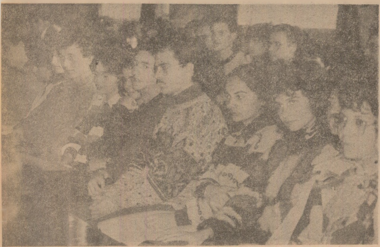
La Institutul de Medicină și Farmacie din Capitală