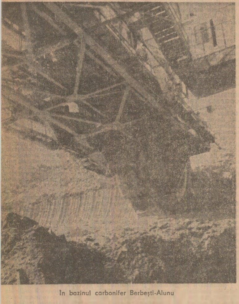
In bazinul carbonifer Berbești-Alunu