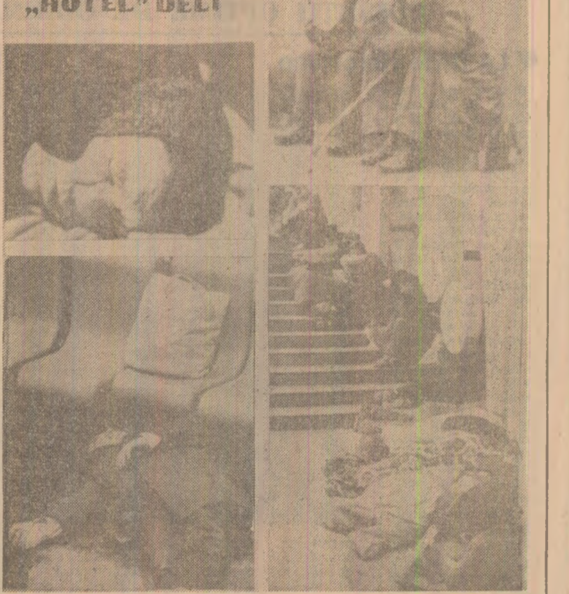
Colidiantul ungar „Nepszava” publică un fotomontaj care surprinde scene dramatice din acest început de iarnă: oameni fără adăpost dormind în încăperi fără geamuri, fără podea și, firește, fără încălzire — după cum recunoaște ziarul în nota ce însoțește aceste imagini — din incinta unor clădiri puse de guvern la dispoziție celor, nu puțin la număr, ce nu beneficiază de un minimum necesar pentru a închiria o locuință. Din cauza frigului, mulți din cei oropsiți se îndreaptă cu predilecție spre săliile de așteptare din gări. Informează ziarul, intitulîndu-și, cu amară ironie, fotoreportajul „Hotel Gara de Sud”, din care reproducem imaginile de alături. Ziarul publică în același număr, sub titlul „Peste rînd: problemele celor fără adăpost”, o relatare despre conferința de presă a purtătorului de cuvînt al guvernului, care informează că între problemele incluse „peste rînd” de ordine de zi a unuia din ultimele ședințe ale Consiliului de Miniștri se numără și lipsa acută de locuințe, „problemă foarte încordată” pentru Ungaria la ora actuală.