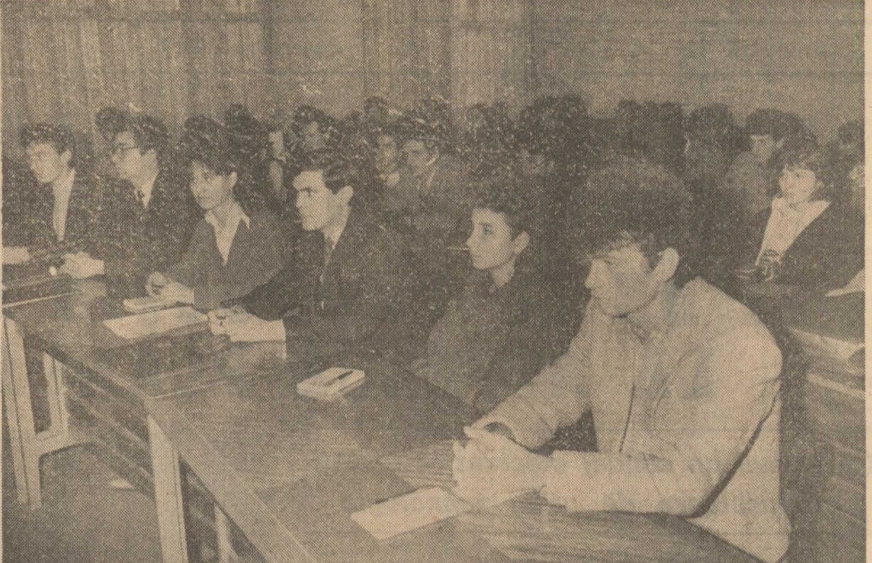
La Institutul Politehnic din București

Cu profund respect și aleasă prețuire se adresează mulțumiri tovarășei Elena Ceaușescu pentru contribuția remarcabilă adusă la înflorirea științei, învățământului și culturii, pentru atenția acordată for-