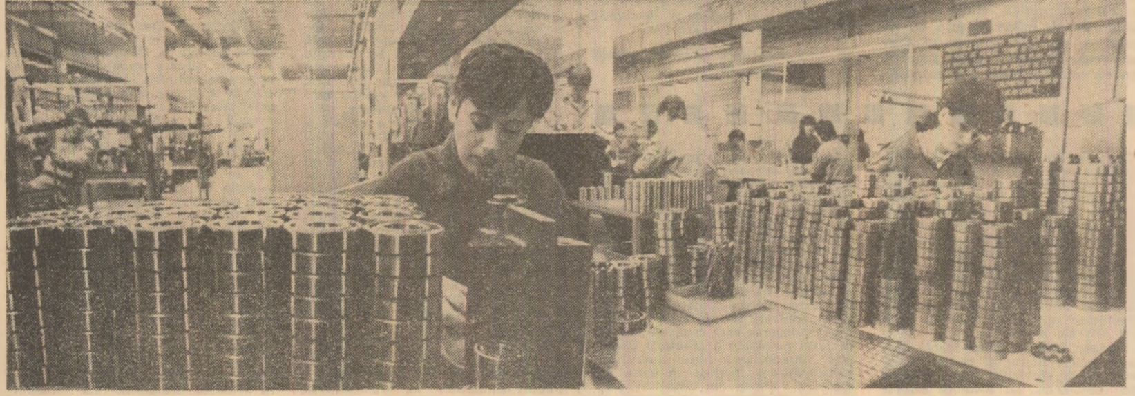
Aspect de muncă din atelierul de montaj al rulmenților

Întreprinderea de Rulmenți din Slatina este cea mai tînără unitate de pe platforma industrială a orașului de reședință a județului Olău. Dată în folosință în luna iunie, în întîmpinarea Congresului al XIV-lea al partidului, noua unitate îmbogățește gama sortimentală a industriei slătine. Rulmenții fabricați la Slatina sînt destinat unei game largi de utilizări în industrie, agricultură, transporturi ș.a. În primăria pe țară, este și tehnologia de fabricație a inelelor interioare și exterioare ale rulmenților care acum sînt confecționate din țevă, și nu din material forjat ori laminat, cum se procedea în alte unități similare. Totodată, țevă pentru fabricarea produselor, tot în primăria, la întreprinderea de profil, pusă și aceasta în funcțiune, nu cu mult timp în urmă, pe platforma industrială a orașului Slatina.