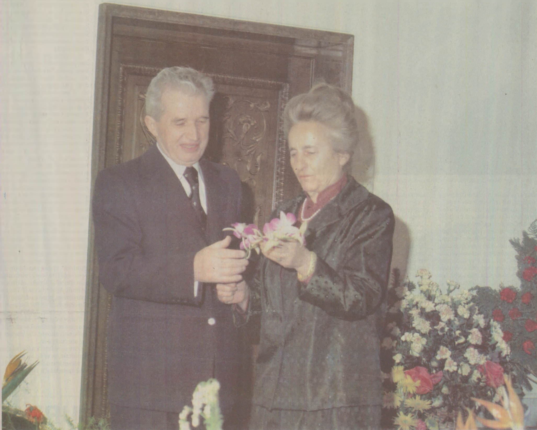
Elena Ceaușescu, încântată de gentilețea sotului ei și de floarea oficială a Republicii Singapore - țara care botezase o orhidee cu numele ei.

„7 ianuarie 1989, ora 10:30 dimineața, într-un studio de filmare al CC”, rememorează cineastul Panțelie Tuțuleasa, fost operator de film al familiei Ceaușescu. „Am găsit-o acolo. Ne aștepta (nu venisem singur să o filmez, eram însoțit de un asistent, dotat cu «sursa de lumină» specială pentru filmul color). Nu mă aștepta pe mine în mod special!”. Deși ar fi putut să îl aștepte, umoristic vorbind, deoarece cele două condiții pe care trebuia să le îndeplinească atunci când, cu ani în urmă, fusese înștiințat, la Sahia Film, că va fi operatorul lor personal de film erau în primul rând profesionalismul, apoi ținuta (prezența). „Tot ce a fost în fața aparatului meu de filmat trebuia tratat egal. Pe Elena Ceaușescu am tratat-o egal. De-a lungul timpului am aflat din lateral că familia Ceaușescu era multumită de profesionalism. Nu cred că îi impresiona prezența fizică. Deși...” Deși la prezența domnului Tuțuleasa stătea foarte bine: 1,81 înălțime și o oarecare asemănare cu actorul Roger Moore - „il opreau atât bărbății, cât și femeile pe Calea Victoriei ca să-i facă acest compliment”, mărturisese soția dănsului. „În acea dimineață a lui 7 ianuarie 1989, Elena Ceaușescu era îmbrăcată