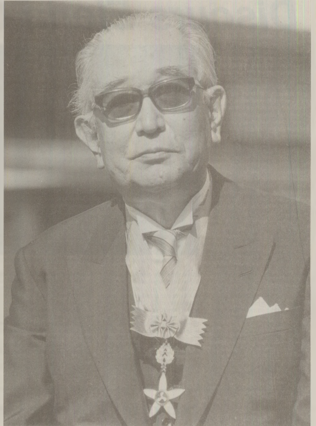
Împăratul Hirohito al Japoniei a domnit timp de 63 de ani pe Tronul Crizantemelor.