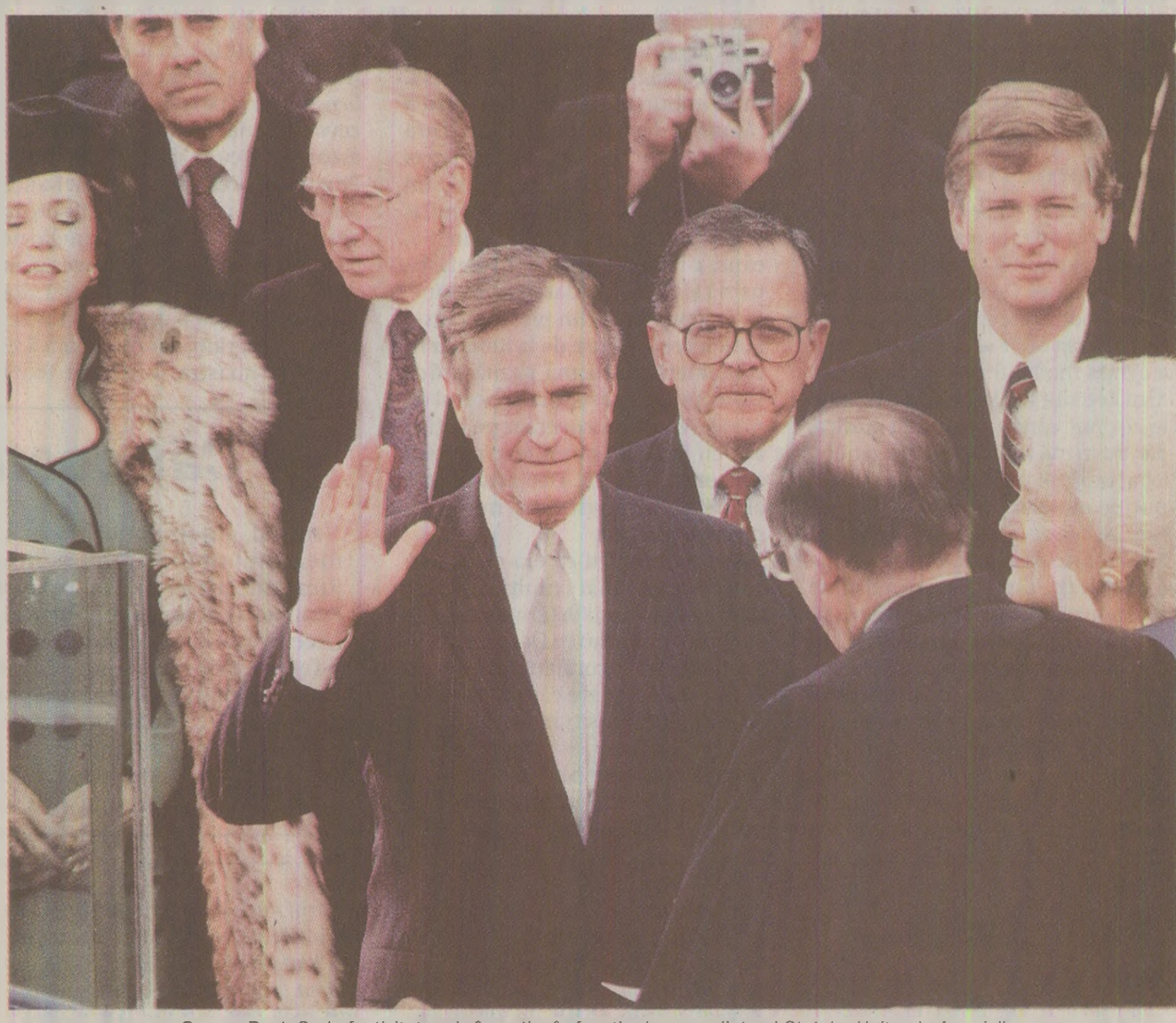
George Bush Sr., la festivitatea de investire în funcția de președinte al Statelor Unite ale Americii

În ianuarie 1989, ziarele românești nu puteau scrie nici despre programul de guvernare al președintelui Bush, nici despre perestroika lui Gorbaciov, nici despre grevele din Polonia. Cu ceva trebuiau totuși umplute paginile dedicate actualității internaționale. Iată câteva dintre subiectele alese de redacția cotidianului Viața Nouă din Galați în ziua inaugurării noii Administrații a Statelor Unite: „În cadrul reuniunii de la Tirana a adjunctilor ministrilor afacerilor externe ale țărilor balcanice, în lăurile de cuvânt ale delegațiilor a fost evidențiată importanța promovării în continuare a cooperării în regiune”.