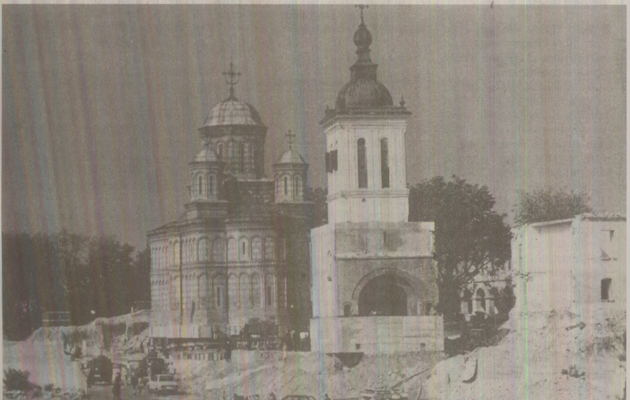
Biserica Mihai Vodă și clopotnița ei, în timpul mutării pe șine