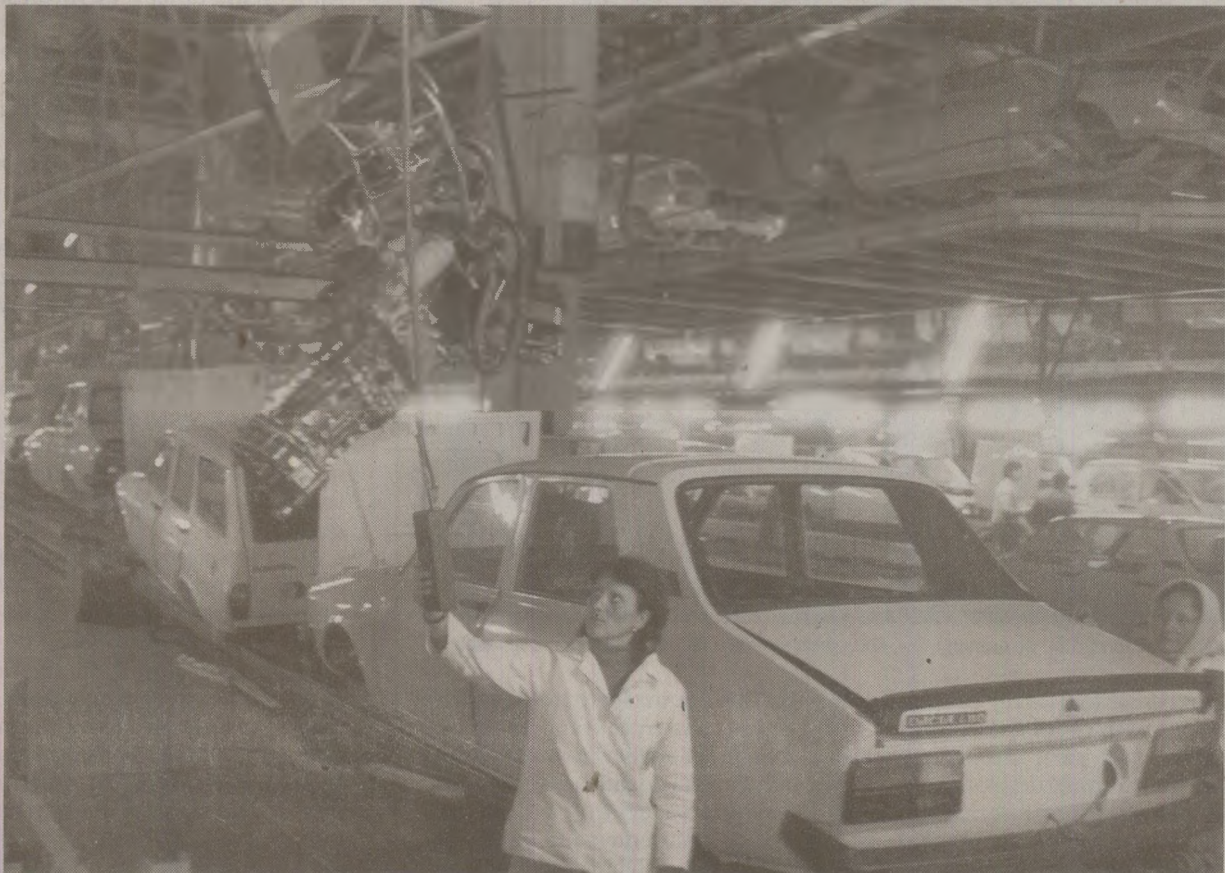
Pentru a cumpăra o mașină Dacia, românii așteptau ani în șir pe liste speciale