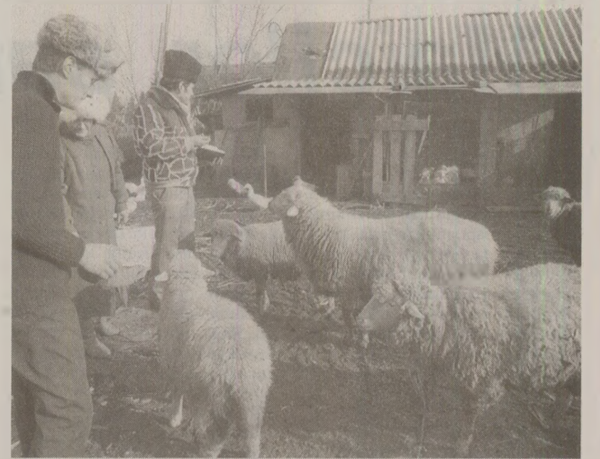
La recensământul animalelor erau mobilizate cadrele didactice din sate