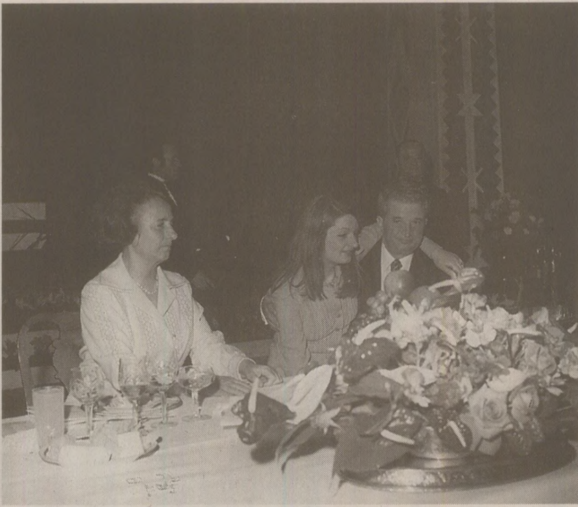
Zoe Ceaușescu îmbrățișându-și tatăl