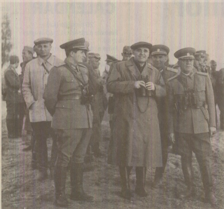
În conducerea politică a Armatei