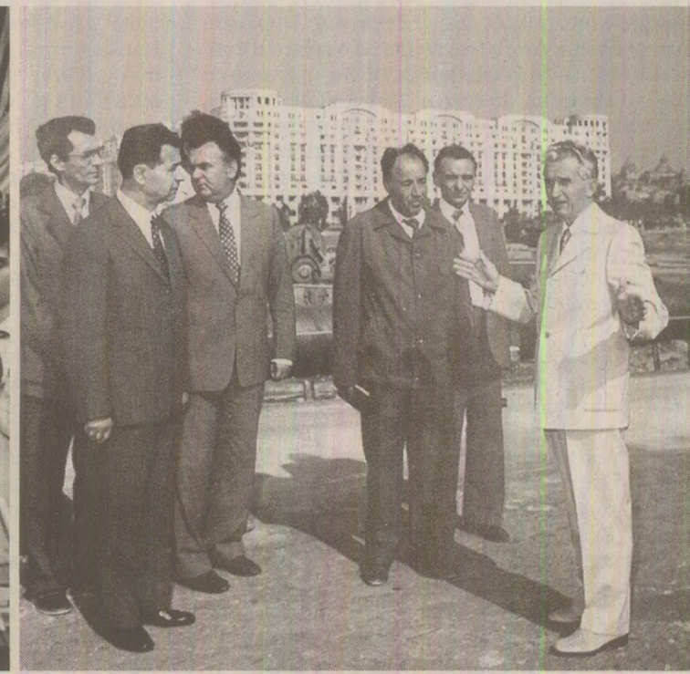
În inspecție la Centrul Civic din București