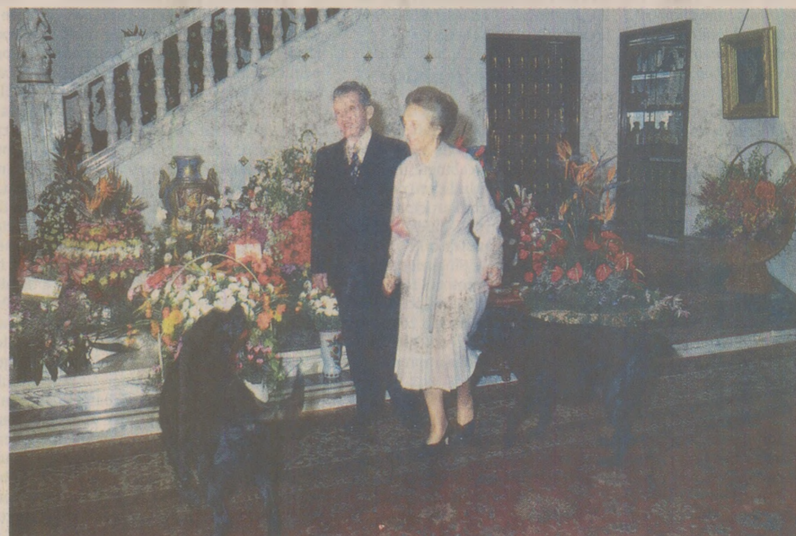
Din toate colțurile țării, pe adresa reședinței prezidențiale de la Palatul Primăverii, soseau mii de buchete de flori și cadouri