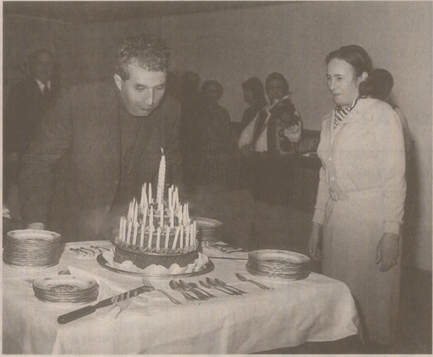
Întro ipostază inedită: suflând în lumânările de port