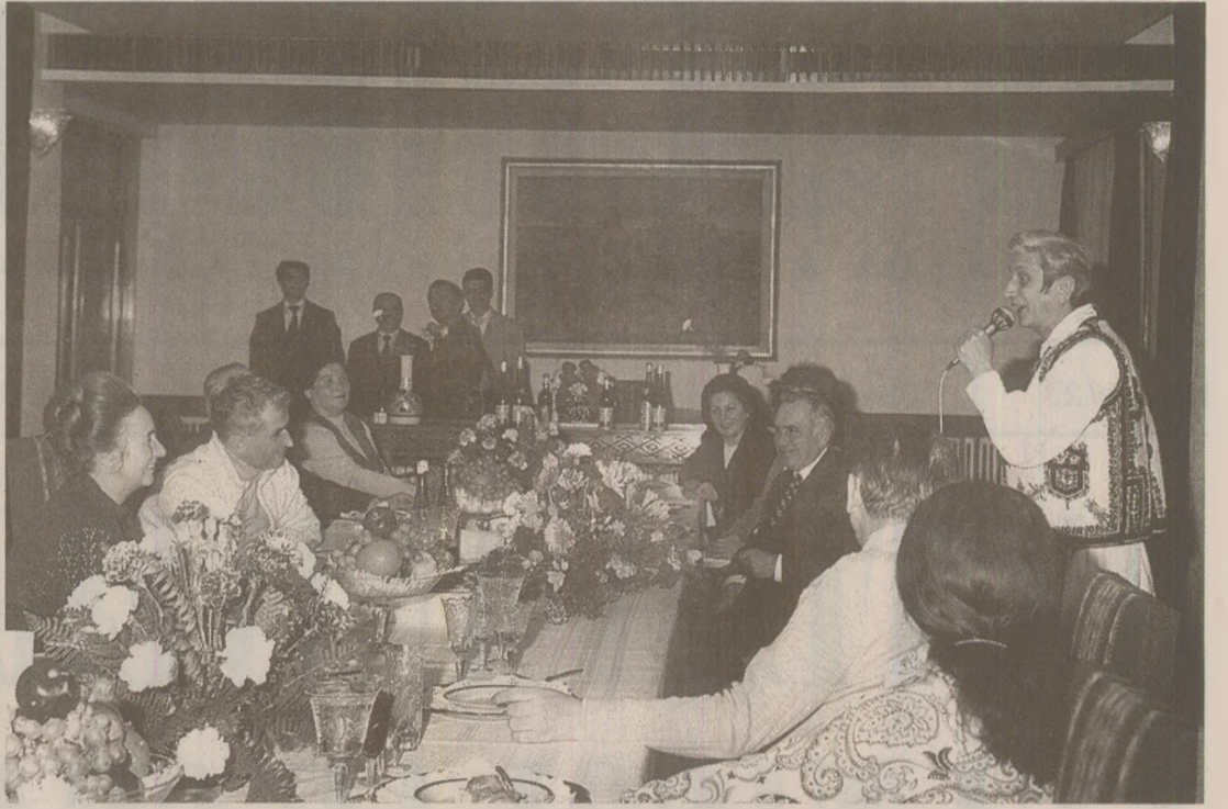
Lui Ceaușescu îi plăcea să petreacă cu lașari ARHIVELE NAȚIONALE