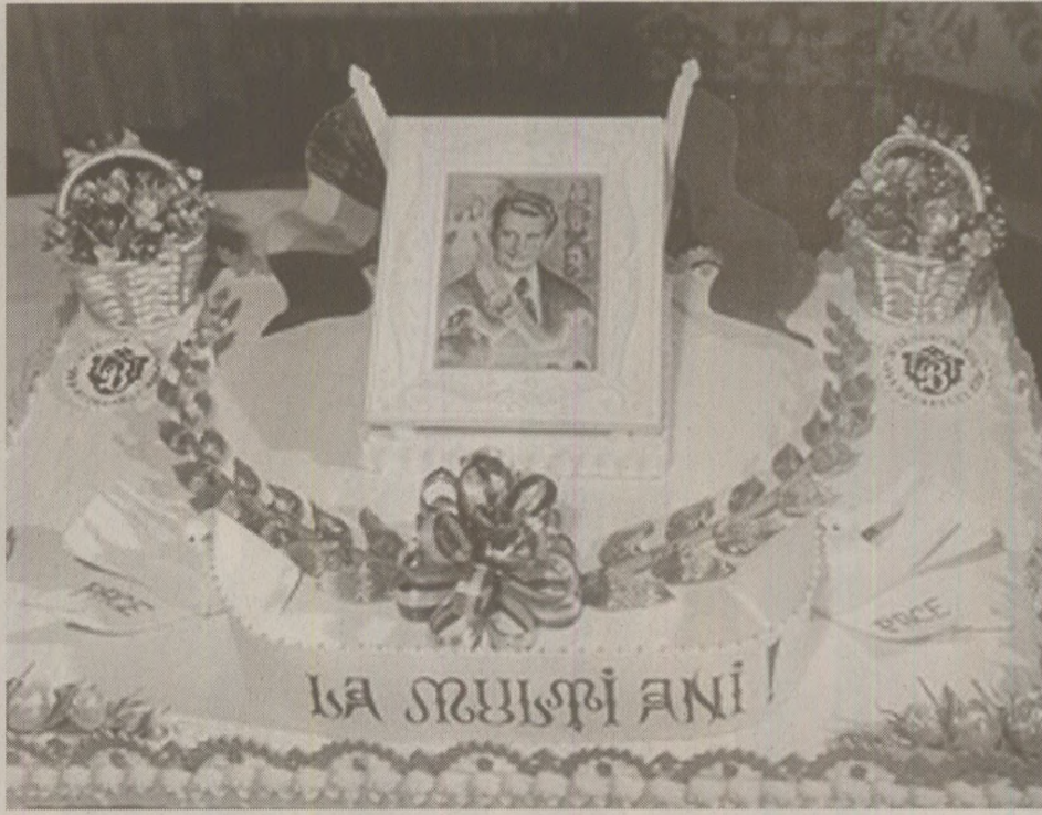
Tort magial pentru „ilustrul conducător” AGERPPRES