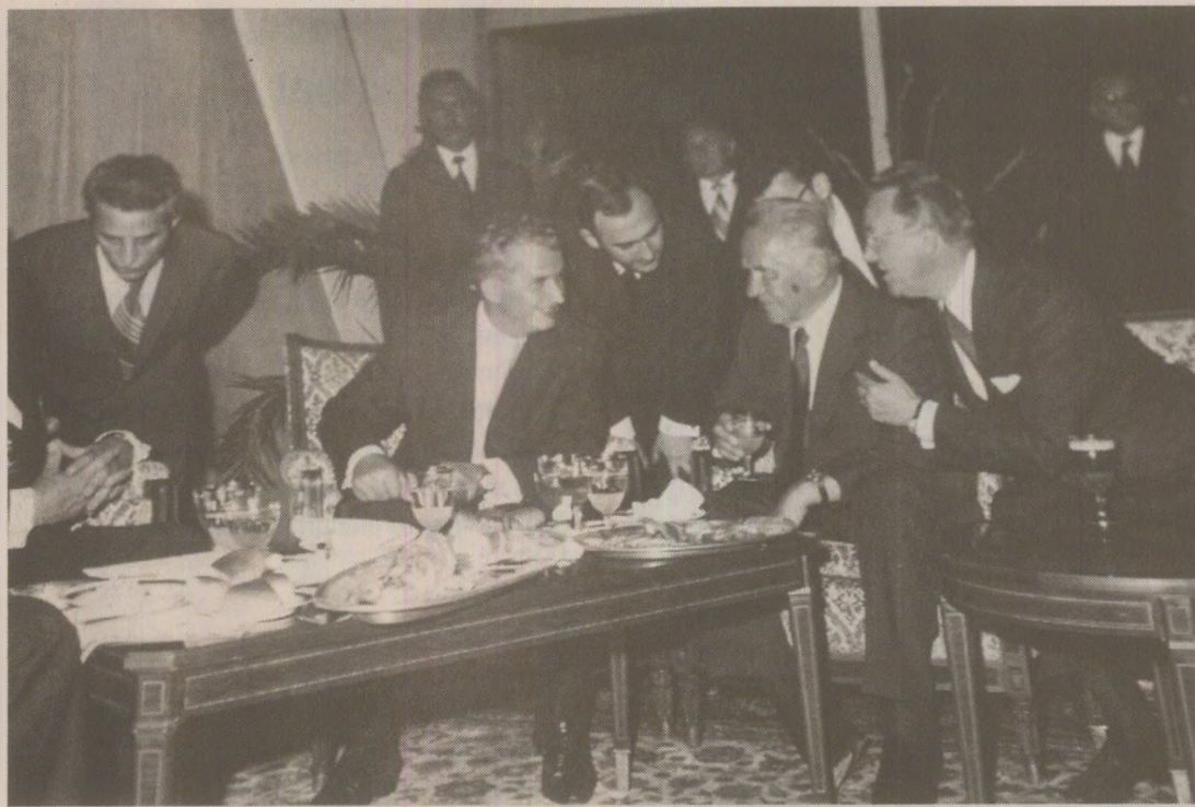
La un pahar cu prietenii apropiați ARHIVELE NAȚIONALE