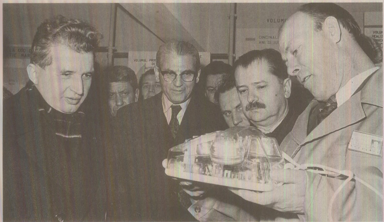
În vizită de lucru, oferind „indicații prețioase” ARHIVELE NAȚIONALE

Consiliul Culturii și Educației Socialiste