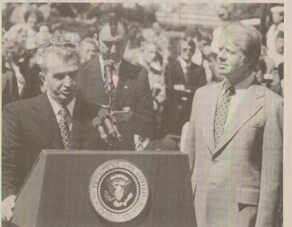
Discurs la Casa Albă (aprilie 1978)