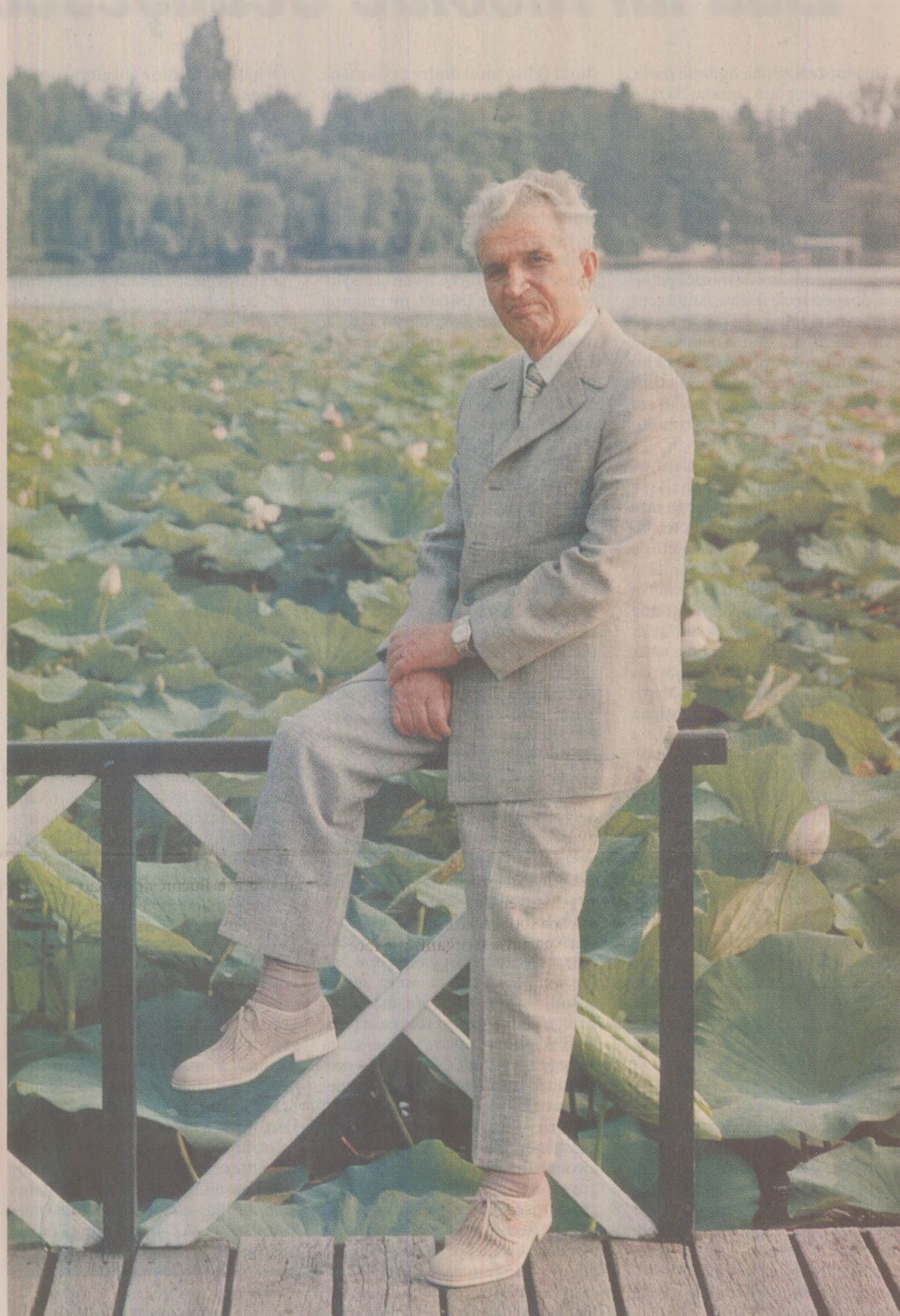
În fotografiile oficiale, Nicolae Ceaușescu apărea doar alături de membrii Comitetului Politic Executiv, sau de „oamenii muncii”. Pentru presa occidentală însă, „conducătorul iubit” poza precum un elegant șef de stat capitalist.

Un obicei s-a păstrat totuși. În fiecare an, aparent „spontan”, un membru de frunte al conducerii îl omagia pe Ceaușescu, în numele său și al celorlalți „tovarăși”. Până la pensionarea (1972) i-a revenit lui Ion Gheorghe Maurer, vreme îndelungată prim-ministru al României, misiunea de a ține speech-ul în cinstea „celui mai iubit fiu al țării”. Mai târziu, a preluat „stafa-ta” Manea Mănescu. La rîndu-i, Nico-lae Ceaușescu „pîndea” momentul cel mai prielnic pentru a da tonul distracției.