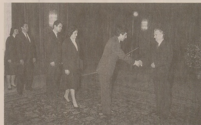
La 26 ianuarie 1989, politicienii români s-au adunat pentru a-și serba pe „eroul neamului”, dar și pentru a-i omagia „activitatea revoluționară”.

pație); Ion (ocupația: plugar); și mai sunt doi mai mici