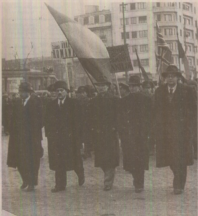
„Jos Rădescu!”, „Guvern Petru Groza!” (1945) ARHIVELE NAȚIONALE