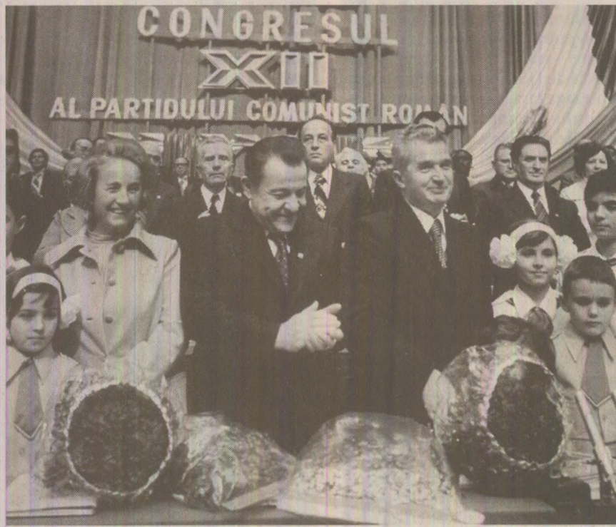
Aclamat la Congresul al XII-lea al PCR (noiembrie 1979)