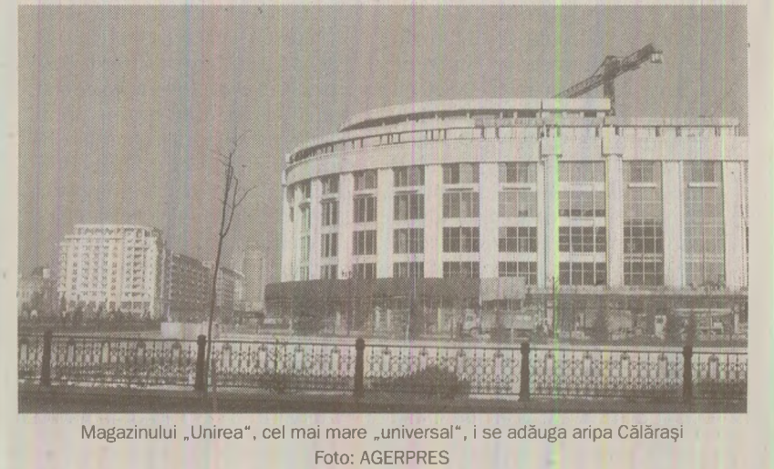
Magazinului „Unirea”, cel mai mare „universal”, i se adăuga aripa Căldărași