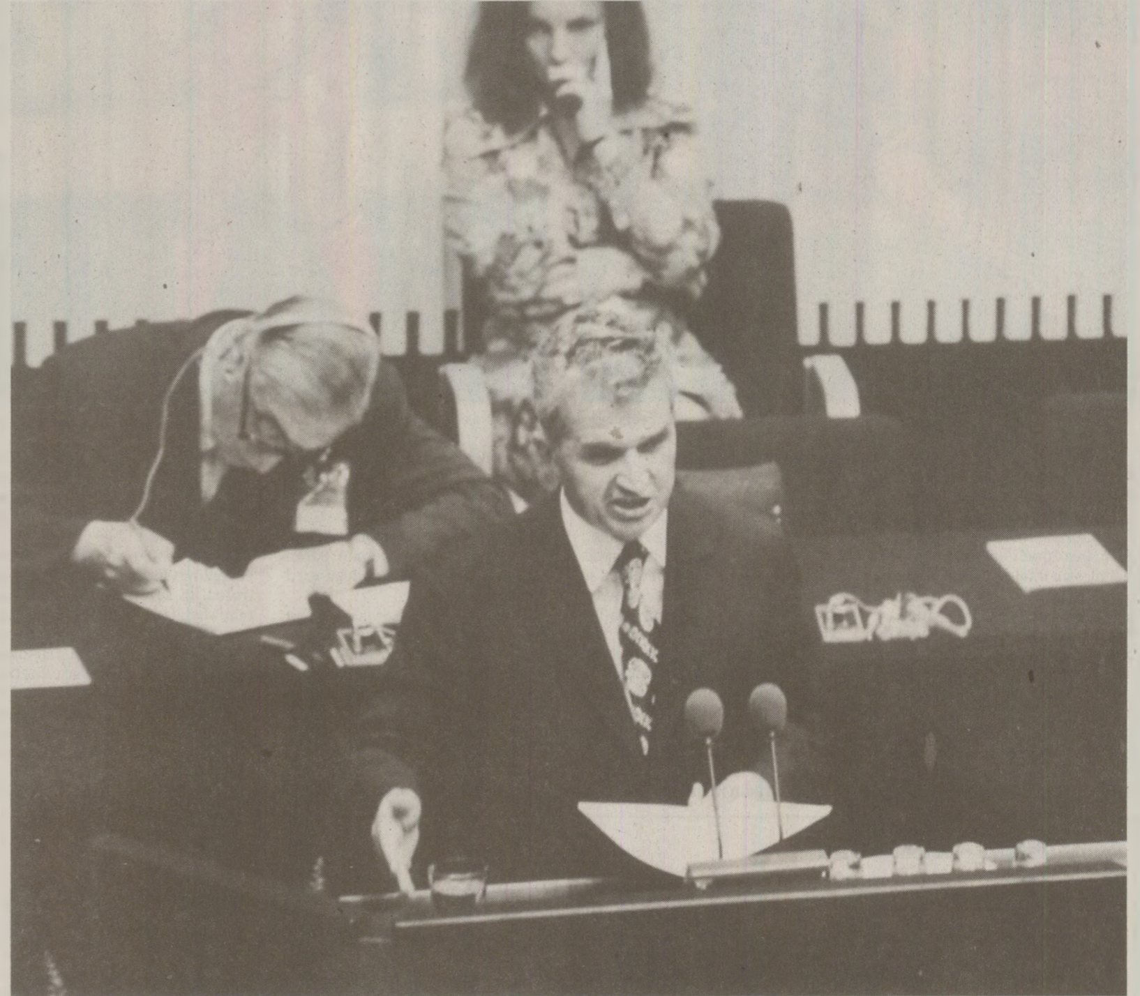
În ciuda zbatelor de vocație mondială ale liderului de la București, vocea României socialiste se auzea din ce în ce mai slab

Discursul lui Nicolae Ceaușescu în fața ambasadorilor acreditați la București reprezintă o sinteză a politicii externe pe care o ducea acesta în anul 1989. Președintele României socialiste ducea o bătaie aprigă cu armele atomice, iar pentru acestea dezvoltase chiar un „Program românesc de dezarmare”, ce-și propunea lichidarea arsenalelor de acest tip până în anul 2000, pe etape. Nicolae Ceaușescu dorea ca experimentele nucleare să fie interzise, la fel și dezvoltarea de noi tehnologii de arme de distrugere în masă, iar spațiul cosmic să fie demilitarizat.