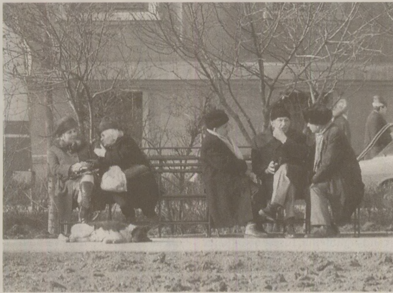
Mulți cetățeni țineau la îndemână sacoșe, în caz că „se băga” ceva la magazine

Ani buni am asistat la un minunat concurs care ar merita din plin numele de sacoșă-viteză. Cele mai puternice concurente de la noi din bloc erau Tanti Dana și Tanti Tanța, fiecare având alături câțiva copii. Aceste două vecine locuiau la parter, una de o parte a scării de intrare, una de cealaltă, cu geamurile spre stradă pe unde treceau camioanele care aprovizionau magazinele de la blocul din față.