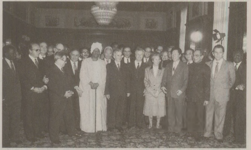
Ceaușescu și-a expus opiniile despre ce s-a întâmplat și ce-ar trebui să se mai întâmple pe planetă în fața corpului diplomatic acreditat la București.

Când ambasadorii din toată lumea au venit la Palatul Consiliului de Stat ca să-l felicite pe președintele Nicolae Ceaușescu cu ocazia Anului Nou 1989, acesta a găsit prilejul de a se manifesta ca lider global. Preocupările președintelui României socialiste erau foarte vaste în politica internațională, în pofida faptului că, în realitate, țara noastră era tot mai izolată. În fața șefilor misiunilor internaționale, Nicolae Ceaușescu s-a arătat nemulțumit de ce s-a întâmplat pe Pământ în anul 1988 mai ales în direcția dezarmării și a atras atenția că în spatele discuțiilor și tratatelor în domeniul au continuat experiențele nucleare, „războiul stelelor” a intrat într-o nouă etapă, Cosmosul devenind tot mai militarizat, iar NATO s-a apucat să și perfecționeze armele nucleare cu rază scurtă de acțiune. Președintele României socialiste băgase de seamă că mișcarea aceasta a Alianței Nord-Atlantice creștea de fapt de patru ori puterea de nimicire a armelor care inlocuiau rachetele distruse prin aplicarea Acordului sovieto-american. „Aceasta în-