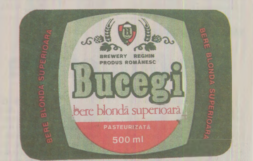
Bucegi, Bere blondă superioară. Asortată o țigară. Tot Bucegi