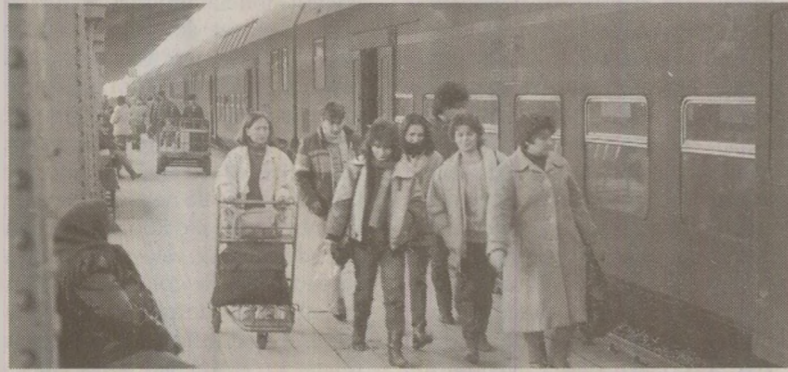
Navetiștii din Girișu de Criș rămăseseră fără trenul ce-i ducea la Oradea

Locuitorii comunei Girișu de Criș ajung la Oradea și de aici înapoi cu un tren care circulă de mai multe ori pe zi între cele două localități. Până în urmă cu câțiva ani, trenul acesta avea o cursă și la ora 14:20 cu plecare din Oradea. Spunem „avea”, pentru că Regionala Căi Ferate Cluj a suspendat-o într-o bună zi. De fapt, ziua în cauză n-a fost deloc bună pentru girișeni. Și iată de ce. Din Girișu pleacă în fiecare dimineață în capitala de județ peste 1500 de oameni. Trei sute dintre aceștia sunt elevi, elevi care nu se pot întoarce acasă de la școală decât după două-trei ore de la terminarea cursurilor. Cam la fel li se întâmplă și celorlalți, fiindcă majoritatea acestora lucrează în industrie, încheind programul, atunci când sunt în schimbul unui, la ora 14:00. Totodată, 33 de elevi ai Școlii generale din Girișu sunt din Cheresig și Toboliu, sate ce aparțin comunei. Trenul de 14:20 le ar fi fost și lor de folos, nefiind nevoiți să facă zilnic pe jos un drum de câțiva kilometri. Dar trenul de 14:20 nu mai există. În schimb, există bunul obicei ca atât oamenii care lucrează în industrie, cât și elevii navetiști să par-