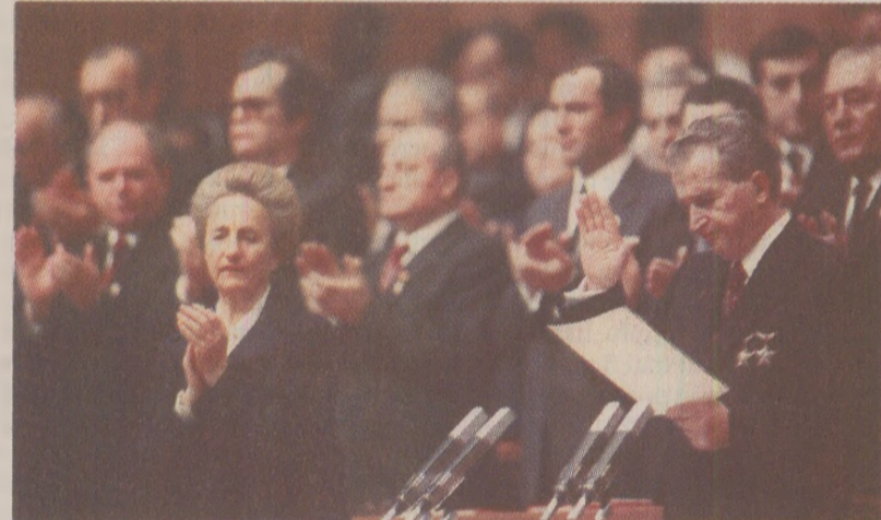
Indicațiile lui Nicolae Ceaușescu din alocuțiunile publice erau literă de lege pentru toți „fiii patriei”