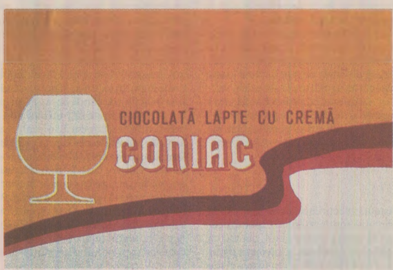
Ciocolata cu cremă de coniac, un desert „tare”