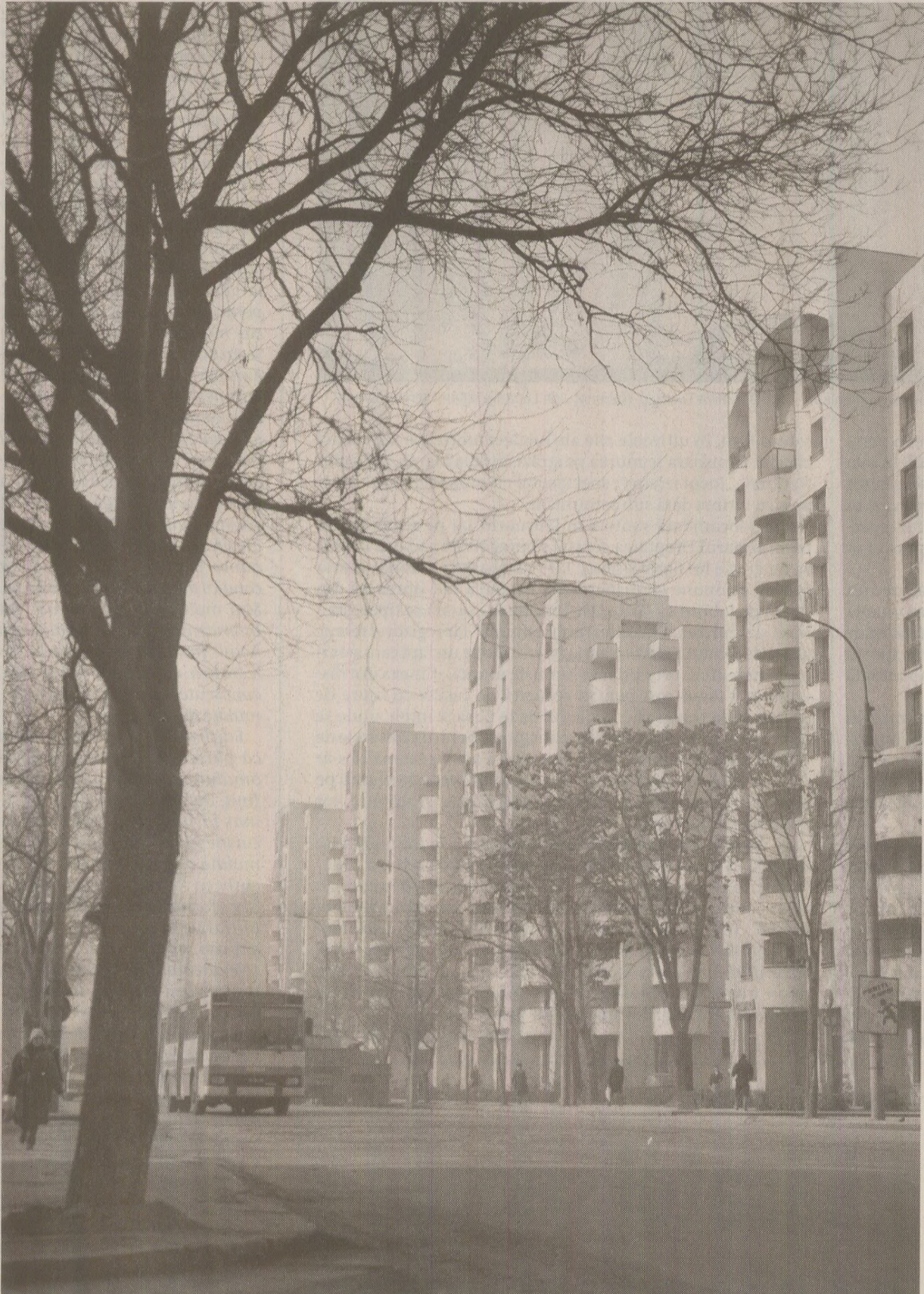
În anul '80, în orașele României au înflorit sute de cartiere de blocuri