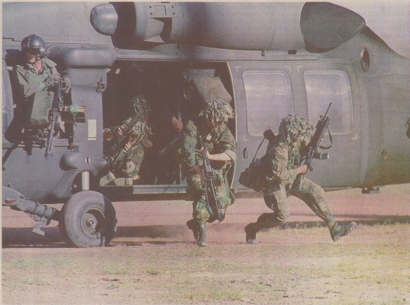
Copiii convocați la Pregătirea Tineretului pentru Apărarea Patriei se visau a fi asemenea soldaților americani plecați în misiuni pentru apărarea democrației

„Eu știu, domn’ profesor: mă arunc la pământ și-mi acopăr capul cu picioarele.” Oricum, nu ne întrecam cu gluma, fiindcă la orele de PTAP era prezentă și arma secretă a profesorului Fratzei – un profesor de atelier, fost boxer, care atunci când te vedea că faci vreo boacăna avea o metodă unică de a te cuminti: „Băi, ia vino încoace”. „Da, domn’ profesor.” „Strânge dinții”, „Cum?”, „Făceai zăpăcit. „Strânge dinții tare!”, îi strângeai și profu’ zdrang, îți altoia un pumn în barbă, suficient de încet să nu te