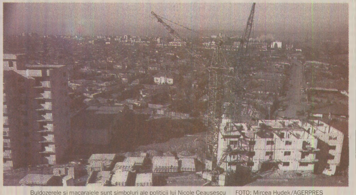
Buldozerele și macaralele sunt simboluri ale politicii lui Nicolae Ceaușescu