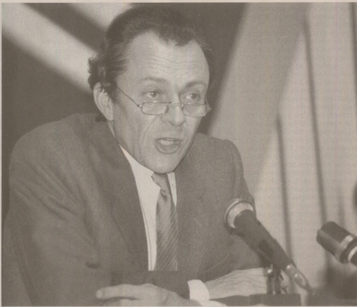
Primul ministru francez Michel Rocard a criticat dur România pentru încălcarea drepturilor omului

Michel Rocard a lansat luni, 6 februarie, un protest binevenit în hățișul drepturilor omului, denunțând negru pe alb condițiile de supraviețuire ale „acestui nefericit popor român” în fața unei comisii ONU obișnuită cu mai multă prudență în exprimare, dacă nu chiar cu mai multă ipocrizie. A spus astfel lucrurile pe nume, punând capăt tăcerii stăjeritoare a majorității conducătorilor occidentali de fiecare dată când se pune problema unei atitudini în ceea ce privește megalomania aiuritoare a clanului Ceaușescu, a nenumăratelor încălcări ale drepturilor omului și ale minorităților, ca să nu mai vorbim despre politica economică, ce riscă să trimită în întreg popor la condițiile de viață din Evul Mediu.