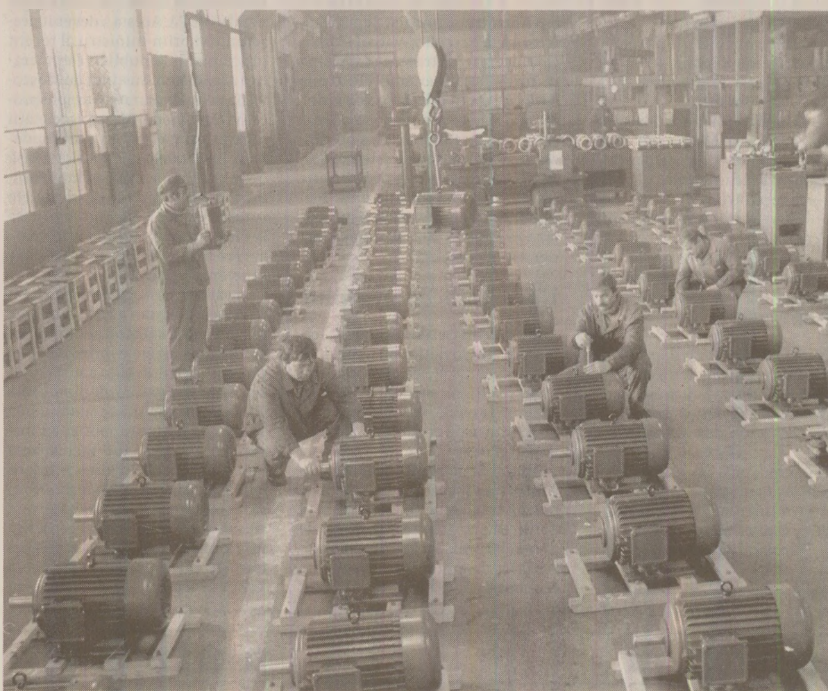
Întreprinderea de Ferite Urziceni producea componente pentru fabricarea motoarelor electrice

În general, producția însoțită de știință de la Urziceni se racordează repede solicitărilor beneficiarilor, dar și impune unele soluții. La solicitări s-a răspuns cu magneții tip segment, dar și cu filtrele magnetice, care economisesc energie electrică, înlocuindu-le pe cele electro-