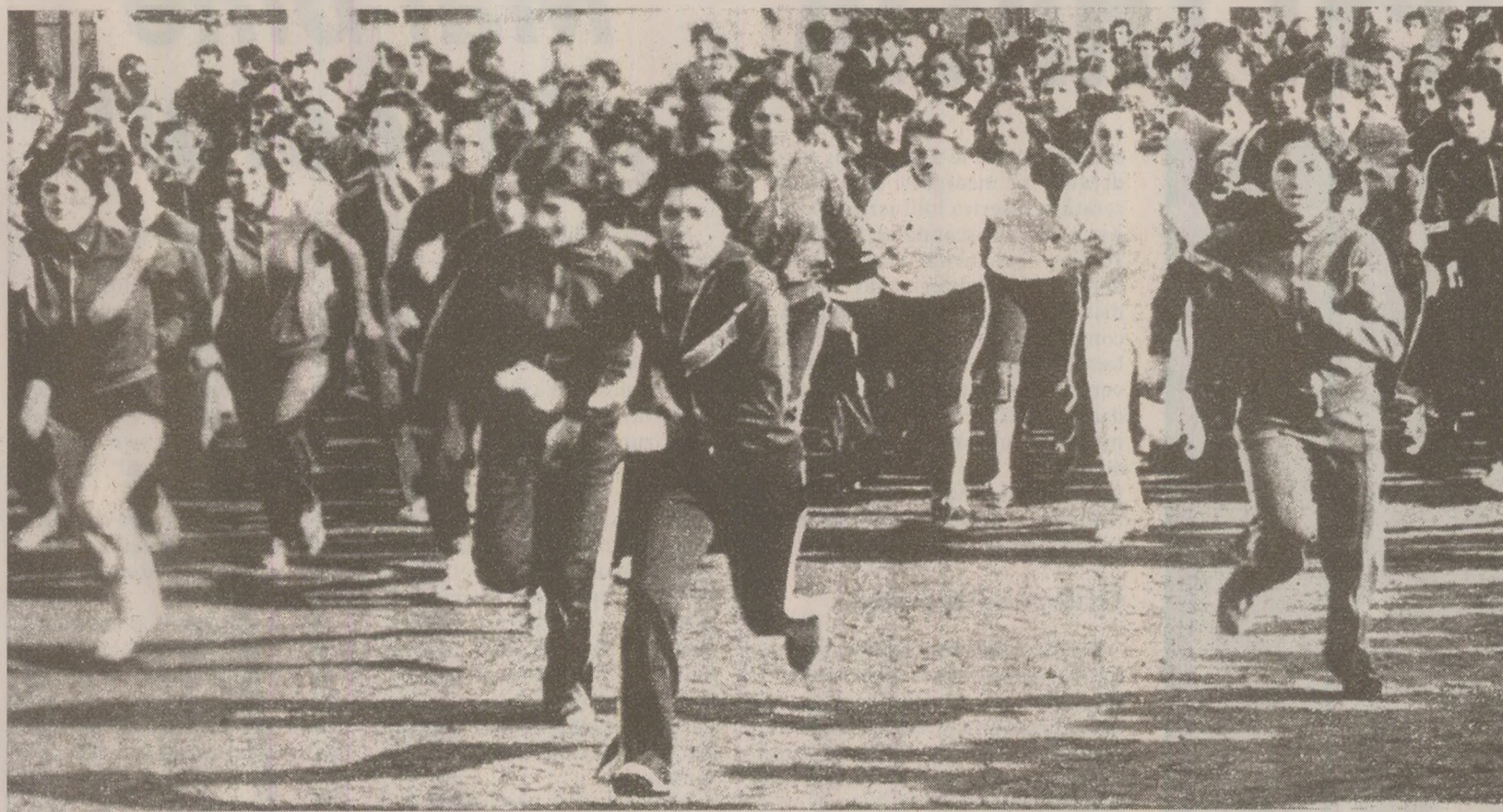
Sute de tineri participau la întrecerile de cros ce aveau loc în întreaga țară

An de an, la 16 februarie, în întreaga țară erau organizate ample manifestări dedicate grevei de la Atelierele CFR Grivița, din 1933. În 1989, chiar dacă nu se împlinea un număr rotund de ani de la evenimentul care i-a propulsat în fruntea ierarhiei PCR pe Gheorghe Gheorghiu-Dej și Chivu Stoica și care l-a transformat într-un fals erou, demn de manualele de istorie, pe tânărul ucenic în căldărie Vasile Roaită, momentul a fost marcat cu fastul evenimentului, inclusiv pe plan sportiv. Peste tot au fost organizate, sub titulatura de Cupa 16 februarie, întreceri sportive la care au participat cu entuziasm zeci de mii de elevi, studenți și oameni ai muncii, de la orașe și sate. De fapt, concursurile s-au întins pe durata a aproape două săptămâni, iar Ziarul Sportul a alocat