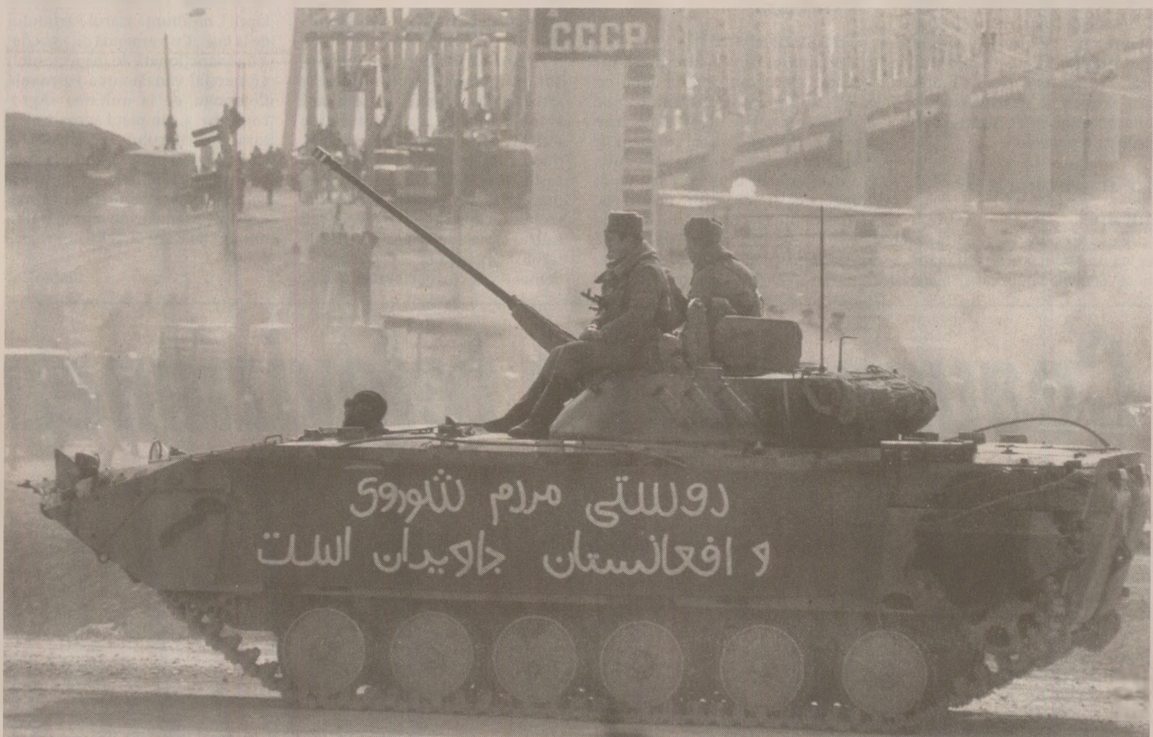
Tancurile Armatei Roșii nu au putut să facă față războiului de gherilă lansat de mujahedinii afgani

La 11 mai 1988, după încheierea acordului de la Geneva semnat de protagoniștii conflictului din Afganistan (Afganistanul, Pakistanul, Statele Unite ale Americii și URSS), M. S. Gorbaciov i s-a adresat printr-o scrisoare lui Nicolae Ceaușescu. Cu siguranță (cu mici modificări ori poate în format identic), același mesaj l-au primit și ceilalți lideri comuniști din componența Tratatului de la Varșovia.