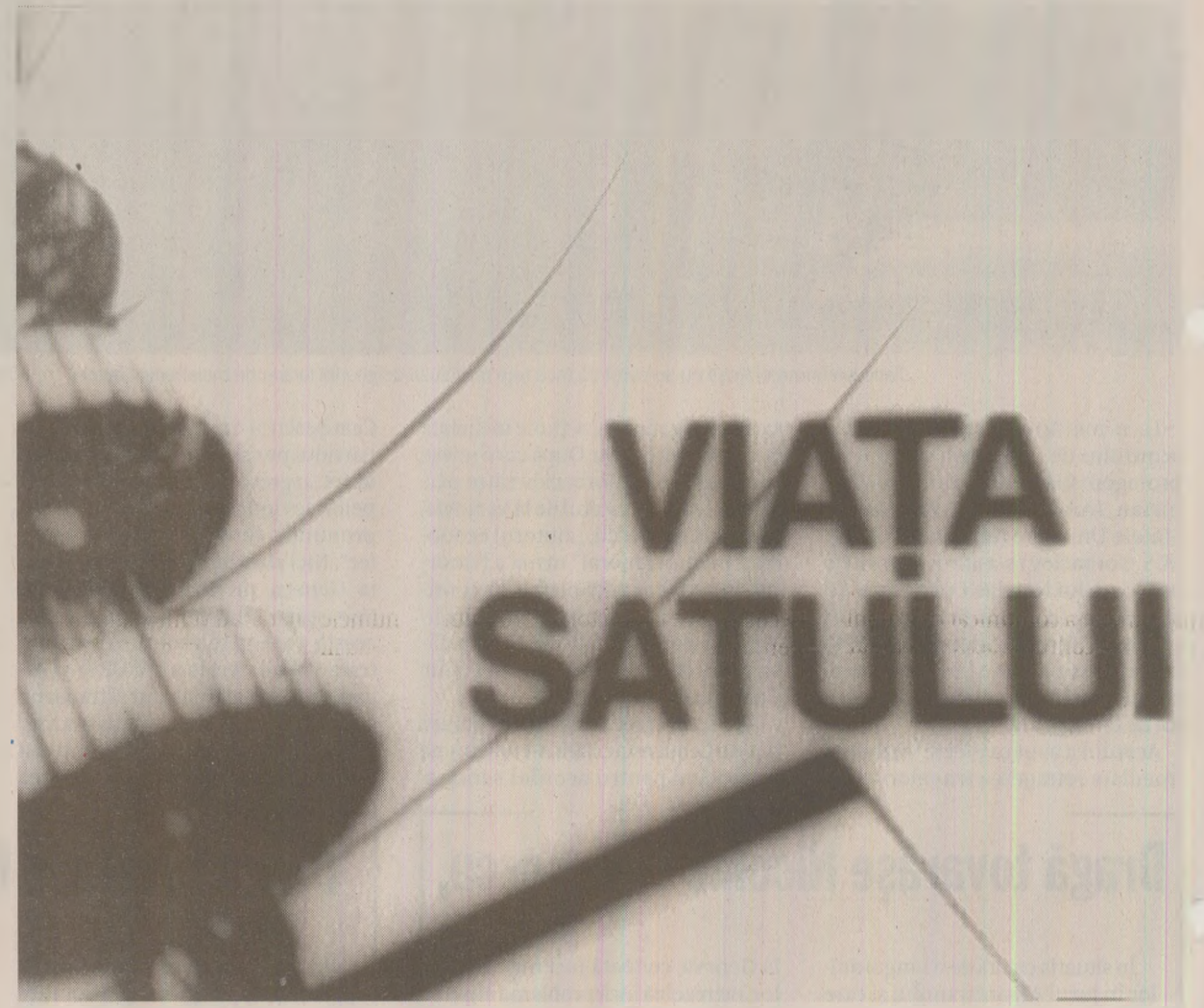
Nicolae Ceaușescu cerea înregistrările emisiunilor Viața Satului și Reflector, pentru a-și crea o „bază de date” privind problemele oamenilor muncii de la orașe și sate

Realizatorul tv își aduce aminte că existau și cazuri când reușeau să-l păcălească pe Tovarăș. „Am