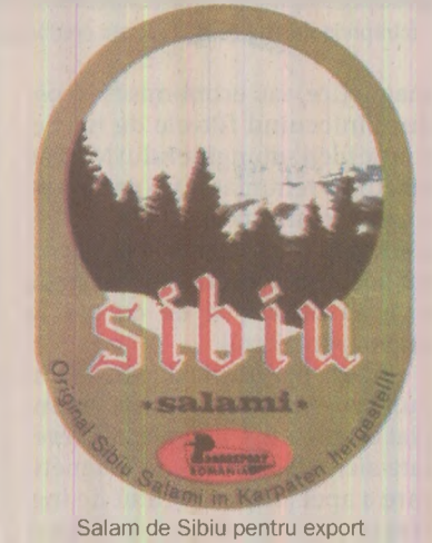
Salam de Sibiu pentru export

nime au fost cuprinse între - 5 și + 2 grade, iar maximele, între - 3 și + 6 grade. În București, vremea a fost în general închisă. Temporar au căzut precipitații, mai ales sub formă de ninsoare. Vântul a suflat slab până la moderat.