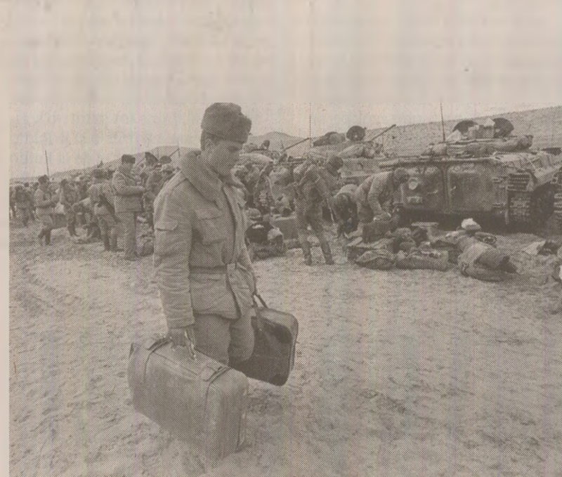
Ostașii sovietici părăseau nisipurile afgane pentru a se întoarce în patrie. Misiunea lor eșuase

În vara lui 1978, o garnizoană din regiunea Nuristan a fost atacată de rebeli. Până la sfârșitul anului, întreaga Afganistan era cuprins de febra războiului civil. Replica autorităților centrale a fost extrem de dură. În decurs de un an și jumătate, circa 27.000 de deținuți politici au fost executați numai în închisoarea Pulecharkhi. Mulți dintre liderii elitelor tradiționale au fost nevoiți să se refugieze în străinătate, mai ales în Pakistan. Violența represiunii a alimentat ostilitatea populației față de guvernul marxist de la Kabul. Focarele de revoltă s-au