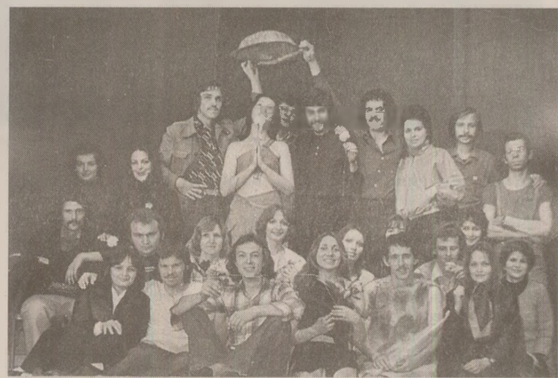
Membrii trupei Thalia, înființată la Timișoara de câțiva actori amatori, pe scena Casei Studenților din orașul de pe Bega