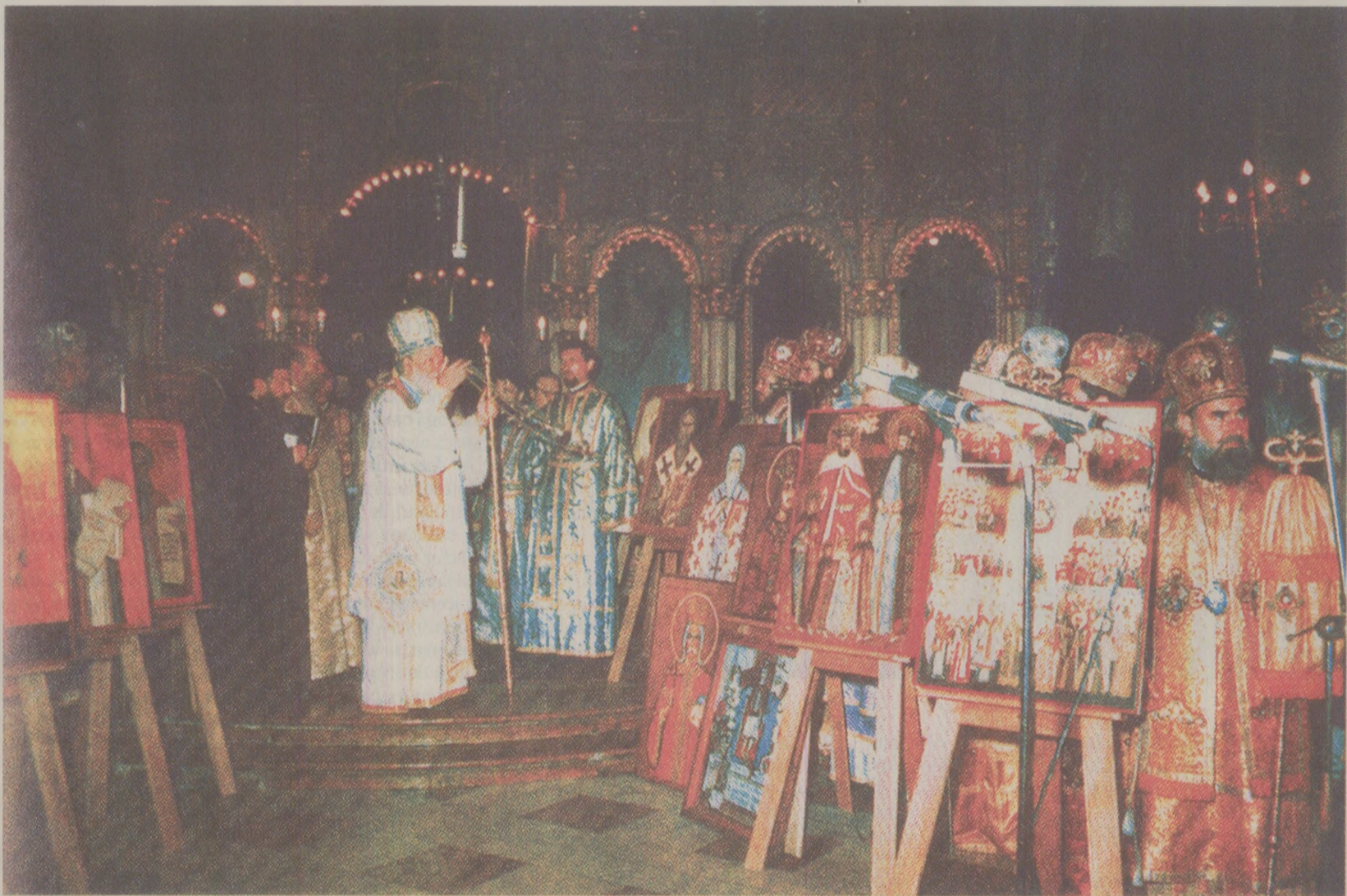
„Pentru conducătorii RSR, Domnul să ne rugăm”, îndemneau preoții duminică în biserică

În statul socialist român activau 14 culte recunoscute oficial: Biserica Ortodoxă Română, Biserica Romano-Catolică, Biserica Ortodoxă de Rit Vechi, Biserica Armeană din România, Cultul Evanghelic de Confesiune Augustană, Cultul Evanghelic Luteran Sinodo-Presbiterian, Cultul Reformist, Cultul Unitarian, Cultul Creștinilor după Evanghelie, Uniunea Bisericii Baptistice din România, Cultul Penticostal sau Biserica lui Dumnezeu Apostolic, Cultul Adventist de Ziua a Șaptea, Cultul Mozaic, Cultul Musulman.