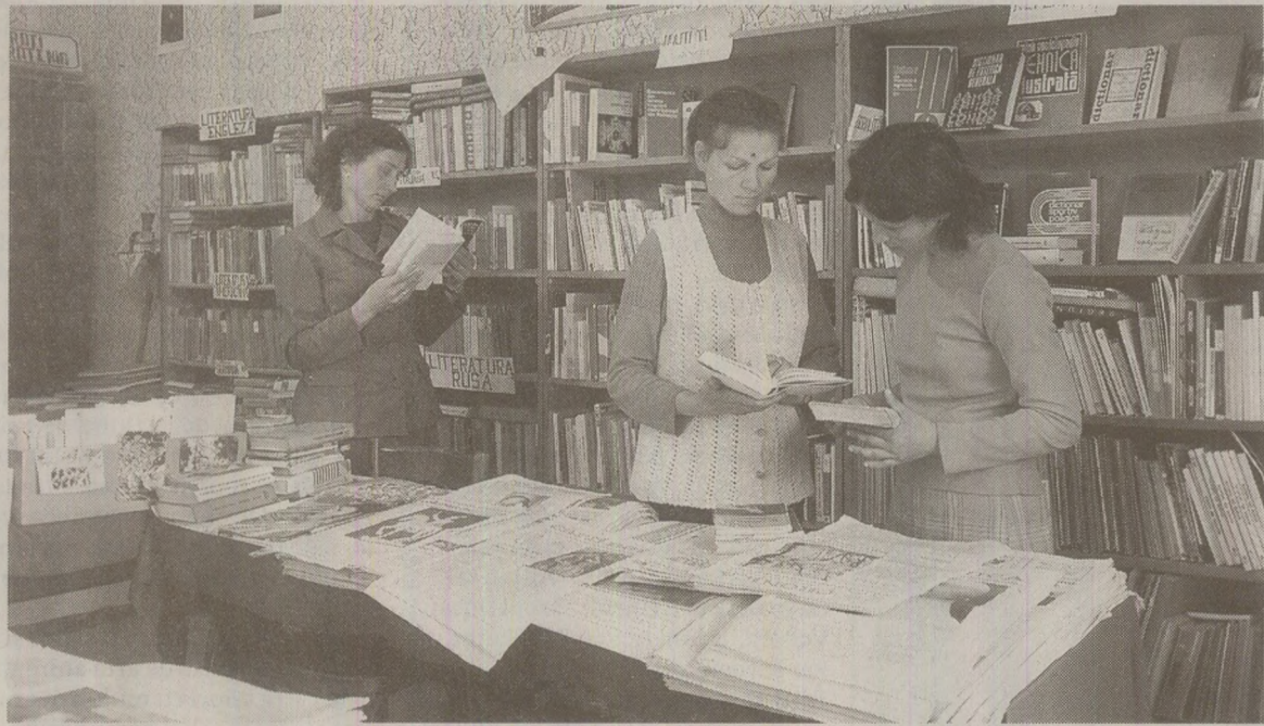
Atitudinea țăranilor în bibliotecă se aseamăna, de multe ori, cu cea a școlărilor cuviincioși, dar timorați