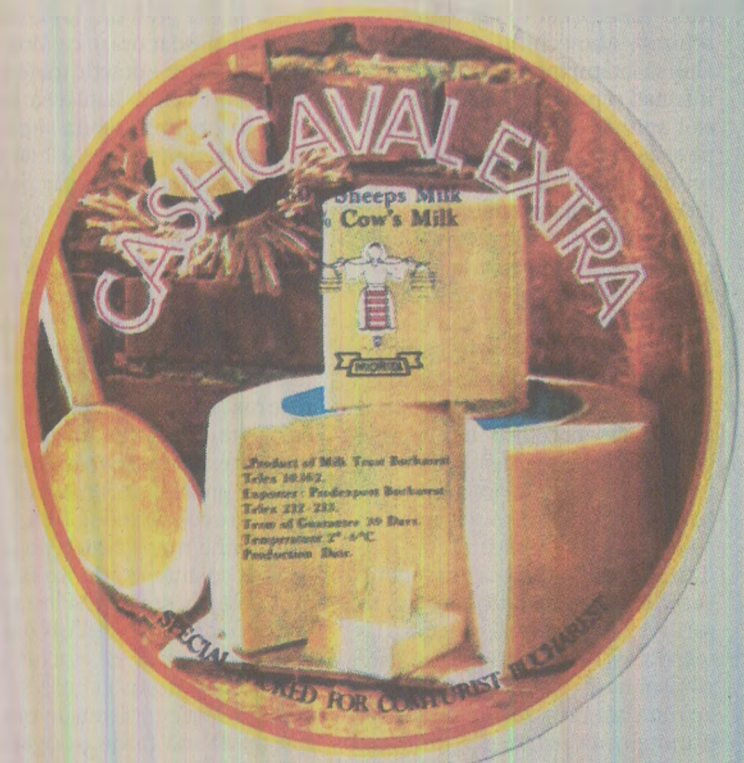
„Cashcaval extra”, produs pentru export, ambalat exclusiv pentru Comturist Bucharest