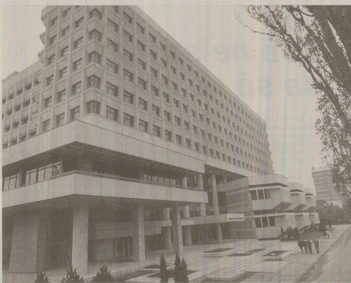
Diploma de la Academia de Științe Social-Politice „Ștefan Gheorghiu” era pașaportul promovării