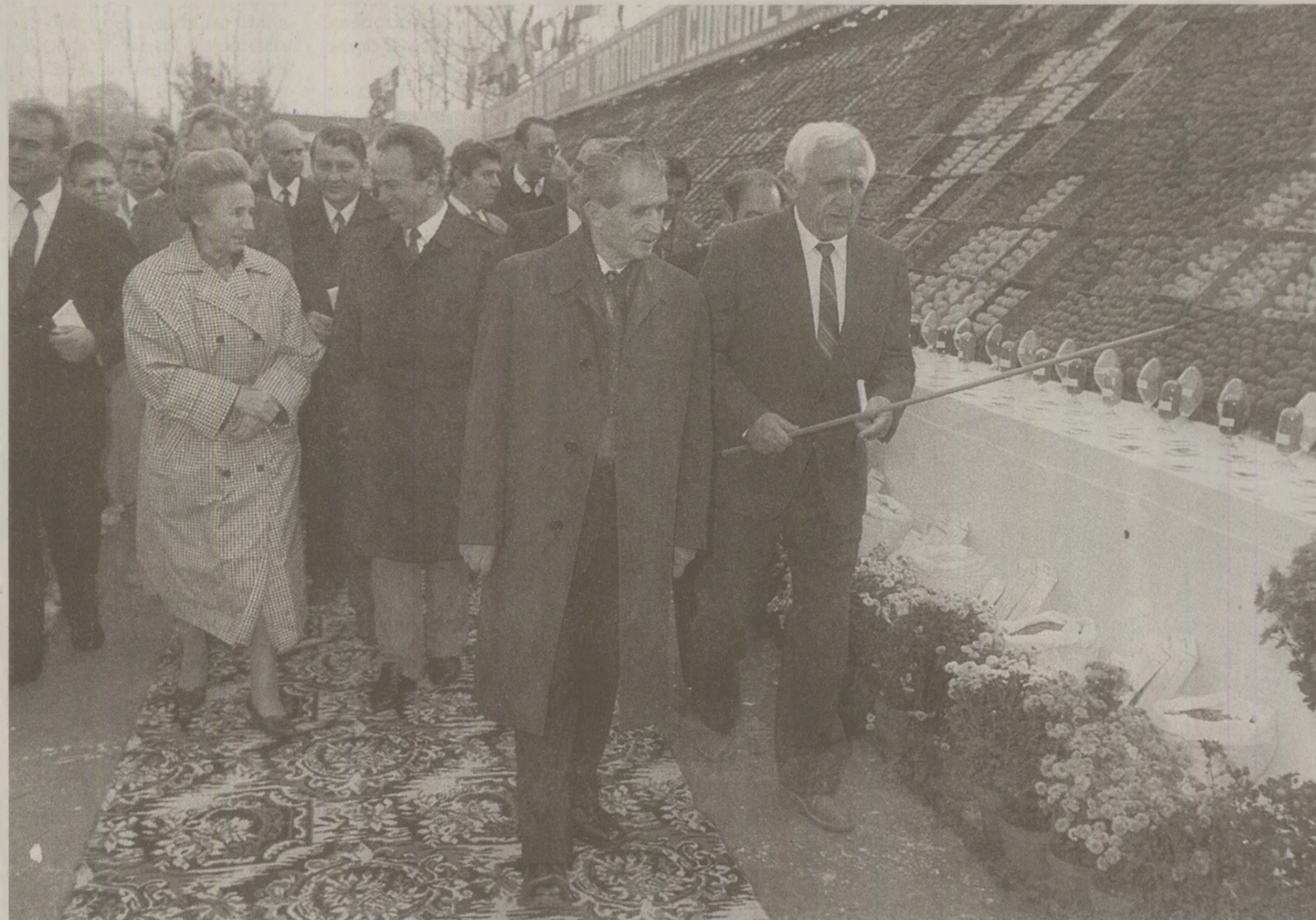
Nicolae Ceaușescu nu lipsea de la marile expoziții agricole

Cum se raportau cifrele imense la culturile agricole? Răspunsul l-am primit tot de la dl Susanu. „Se lua ca și de reper primul județ, Constanțeni, spre exemplu, aveam obicei să dea prima producție de grâu. Eu, întotdeauna, luând reper cifra, puneam cinci kilograme mai mult... Sigur că erau și colegi din zona colinară care erau foarte afectați de modul ăsta de raportare. Nimeni nu credea însă în ele, nici noi, nici ei. Undeva, în psihoza colectivă, contribuiau în mod ne-