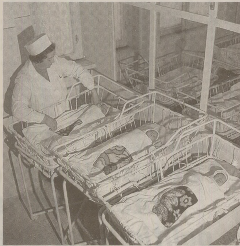
Efectul legislației antiavort: „Decrețelii”

Avocatul din oficiu care a apărut-o pe A.T. a cerut pentru aceasta o pedepsă orientată spre minimum social prevăzut de lege și, totodată, să se dispună executarea pedepsei