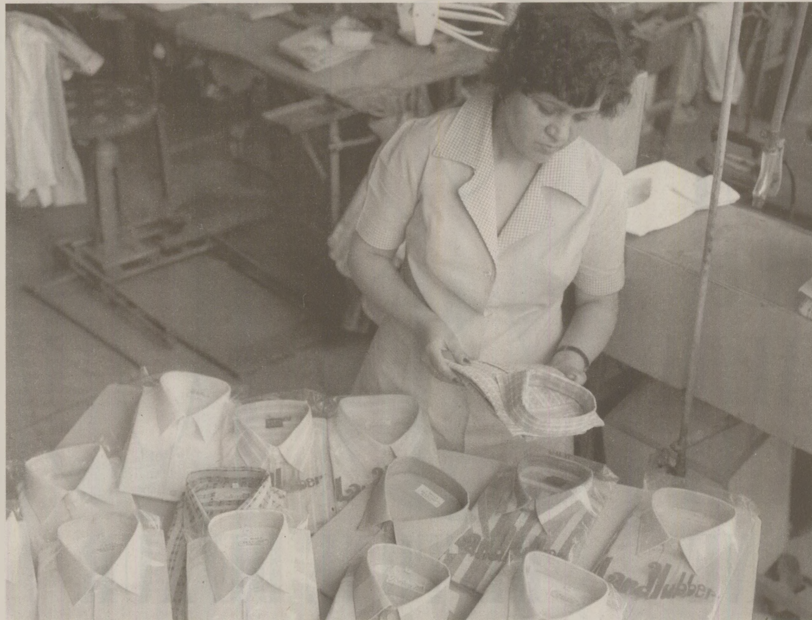
În 1989, exportul produselor de cea mai bună calitate era o prioritate, românii beneficiind majoritar de rebuturi

S-a mai temut pentru siguranța sa și a familiei sale în toamna anului 1989, când Ceaușescu și-a făcut ultima vizită de lucru la Brăila. „În minte că am stat o zi și o noapte, cu toată întreprinderea, să asfaltăm alei și să dăm cu var, fiindcă tovarășul anunțase că vine și la fabrica noastră. N-a mai venit la noi, dar eu n-am scăpat fiindcă am fost convocată, la fel ca toți directorii din Brăila, la Consiliul Popular, unde Ceaușescu urma să primească un raport din partea primului-secretar. Noi am fost băgați în două birouri de lângă sala de ședință, ca să fim la îndemână în caz că tovarășul întreabă ceva despre o între-