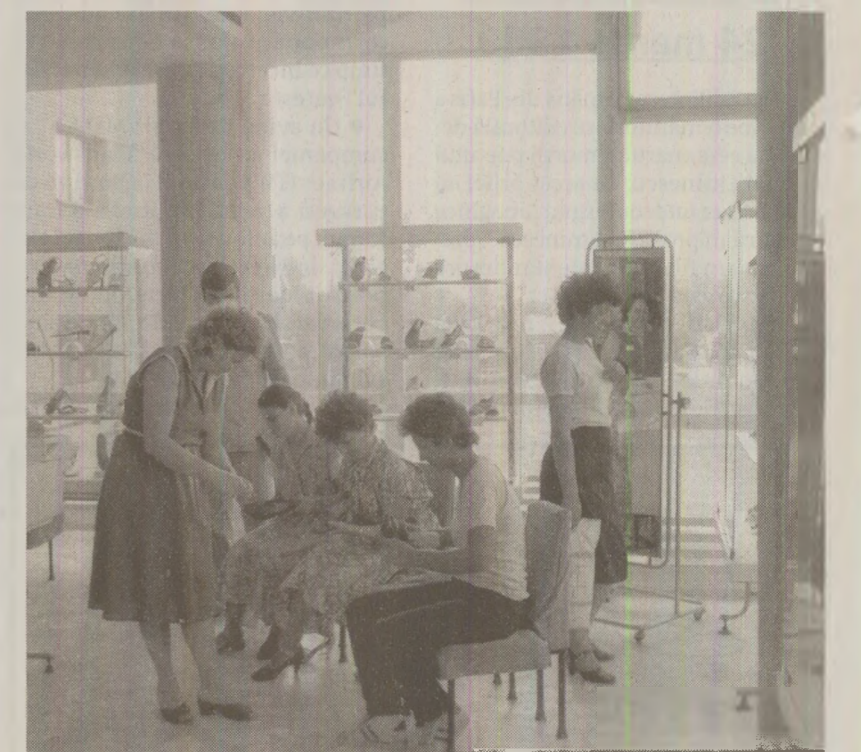
Magazinele pentru femei au pus în vânzare modele noi de încălțăminte, adecvate sezonului