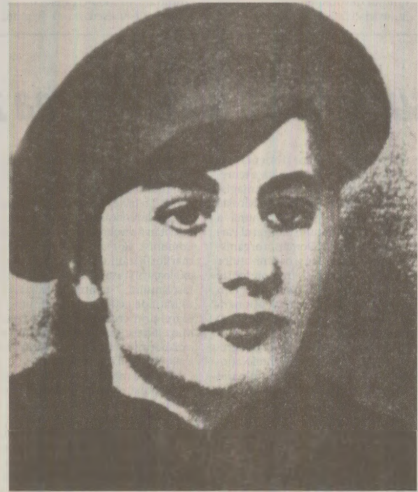
În 1989, Elena Ceaușescu afirma, în cercuri restrânse, că în tinerețe, de 1 Mai, ieșea la iarbă verde și recita poezii

Constantin Olteanu a fost chemat și de Nicolae Ceaușescu. „Prin iulie – relatează acum –, m-a chemat și m-a întrebat: «Cum ați tratat voi 23 August – ce a fost atunci, ce-a reprezentat?». Și eu i-am spus: «Știți că sunt niște reconsiderări. Adică în legătură cu activitatea monarhului, participarea partidelor istorice, că fuseseră niște alianțe...». «Bine, a zis el. Dar să nu mai vorbim despre dictatura regimului antonescian ca dictatură fascistă. Că nu a fost așa».