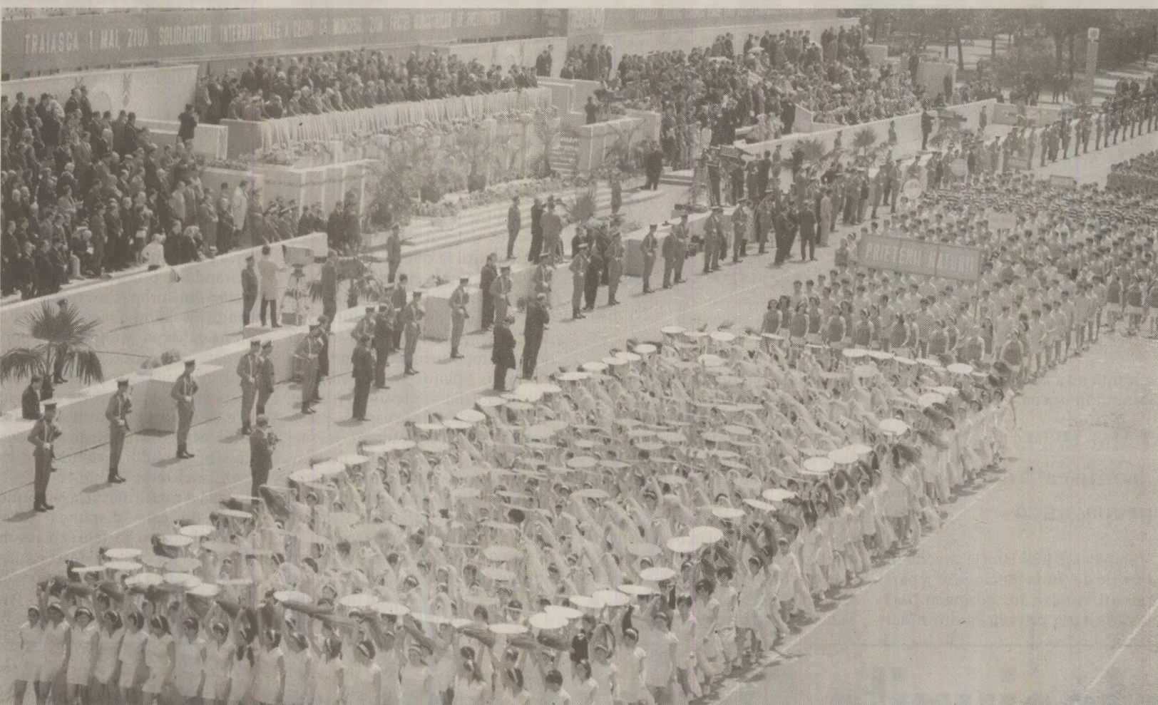
Trecuse vremea marilor demonstrații din anii '70

La 1 Mai 1989, susțineau ideologiile regimului, se împlineau 50 de ani de la „Marea demonstrație patriotică antifascistă și antirăzboinică” de la 1 Mai 1939, organizată de Nicolae Ceaușescu. În acel an, Ceaușescu abia împlinise 21 de ani și ieșise de câteva luni de la Doftana. Putea el să organizeze o manifestație de mare amploare, cu caracter comunist, într-un stat condus de un regim autoritar, cum era cel al lui Carol al II-lea? Nimic mai fals. Caracterul comunist al demonstrației de la 1 Mai 1939, precum și rolul organizator al lui Nicolae Ceaușescu au fost o invenție a propagandei de la un capăt la altul.