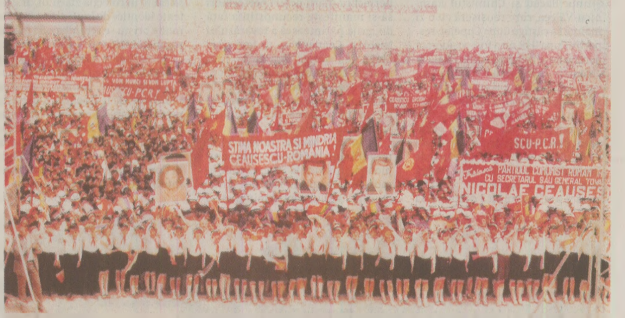
Lozincile erau stabilite cu multe luni înainte de momentul manifestației

frățescă și solidaritatea tuturor țărilor socialiste! 33. Trăiască prietenia și colaborarea dintre toate popoarele lumii! 34. Să triumfe lupta popoarelor pentru întărirea securității și colaborării în Europa și în întreaga lume! 35. Să triumfe politica de destindere, colaborare, securitate, pace și independență națională! 36. Trăiască lupta unită a popoarelor pentru pace, dezarmare, pentru o lume fără arme și fără războaie! 37. O sută de ani de la declararea zilei de 1 Mai ca zi a solidarității internaționale a celor care muncesc. Arhivele Naționale, Fond CC al PCR - Secția Cămin, dos. nr. 12/1989