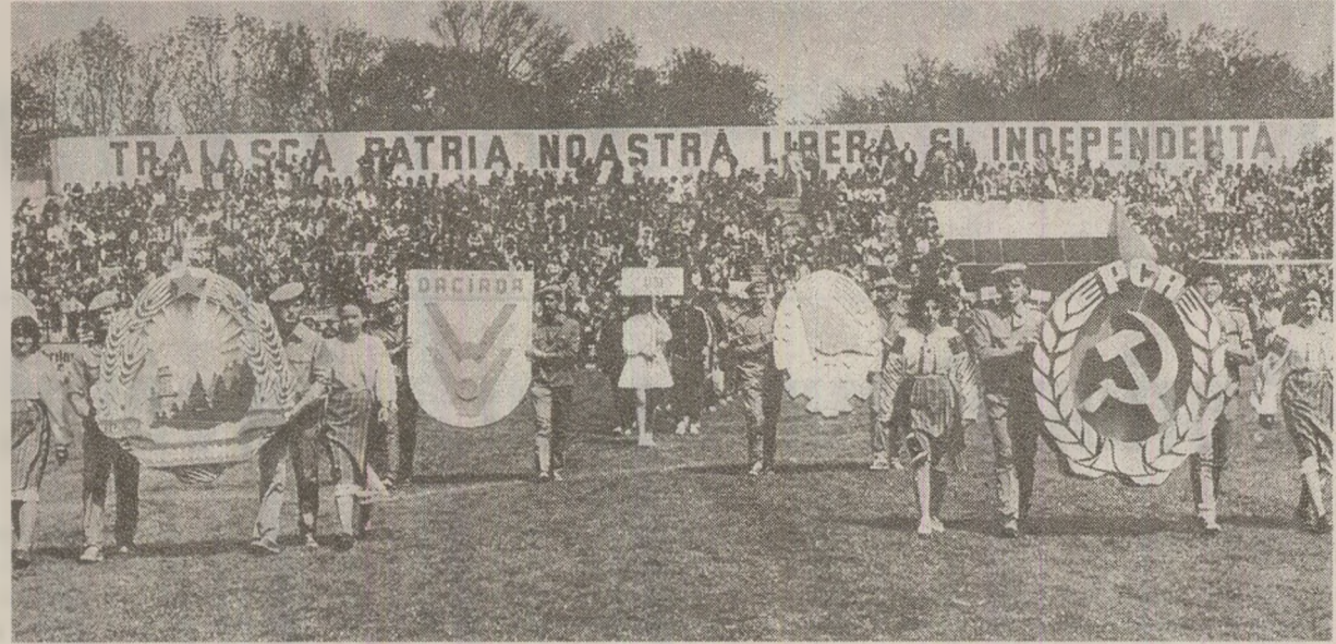
La competițiile sportive organizate cu prilejul zilei de 1 Mai erau mobilizați mii de participanți

Mihai Sturdza Radio Europa Liberă (München) — Raport al secției de cercetare, condusă de dr. M. Șofar. Document din „Arhiva 1989”, Universitatea Babeș-Bolyai, Cluj-Napoca (Traducere din limba engleză de Eliza DUMITRESCU)