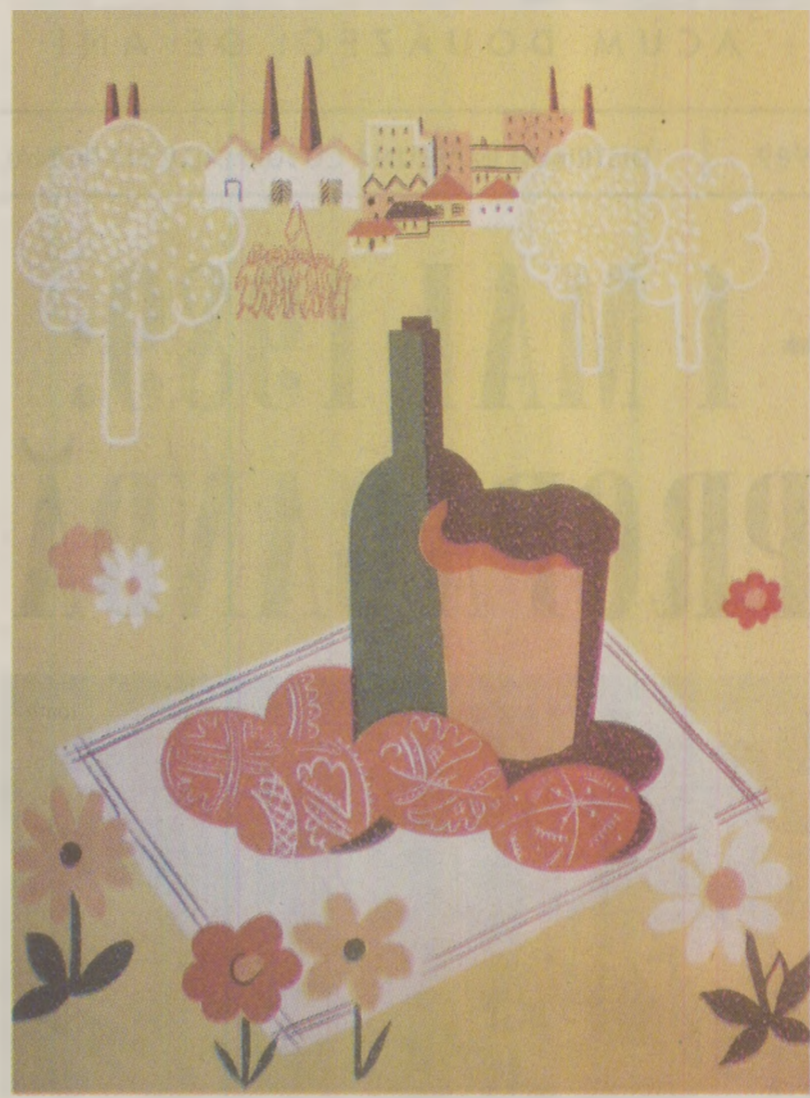
Propaganda de stânga din perioada interbelică susținea că 1 Mai era „Paștele Muncitorilor”